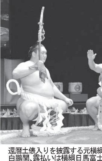
還暦土俵入りを披露する元横綱千代の富士の九重親方。太刀持ちは横綱白鵬関、露払いには横綱日馬富士関

赤土のコートで奮闘 82年ぶり快挙に大歓声 年に伊達公子(現姓ケルム伊達)エステティック(TBC)が4強入りした。ツォンガは第4シードのトマーシユ・ベルディハ(チェコ)を破り、第8シードのスタン・パブリンカ(スイス)も順当にベスト8入りした。第2シードのロジャー・フェデラー(スイス)とガエル・モンフィス(フランス)の4回戦は第2セット終了後に日没で順延となった。錦織選手、赤土で8強入りした。