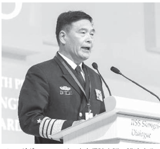
シンガポールのアジア安全保障会議で講演する中国軍幹部の孫建國副総参謀長

【シンガポール共同】中国人民解放軍の孫建國副総参謀長は31日、シンガポールのアジア安全保障会議で講演した。南シナ海での岩礁埋め立ては「軍事、防衛上の必要なニーズを満たすため」と述べ、軍事目的が含まれていると明言した。中国軍幹部が公の場で埋め立ての軍事目的に言及したのは初めてとみられる。