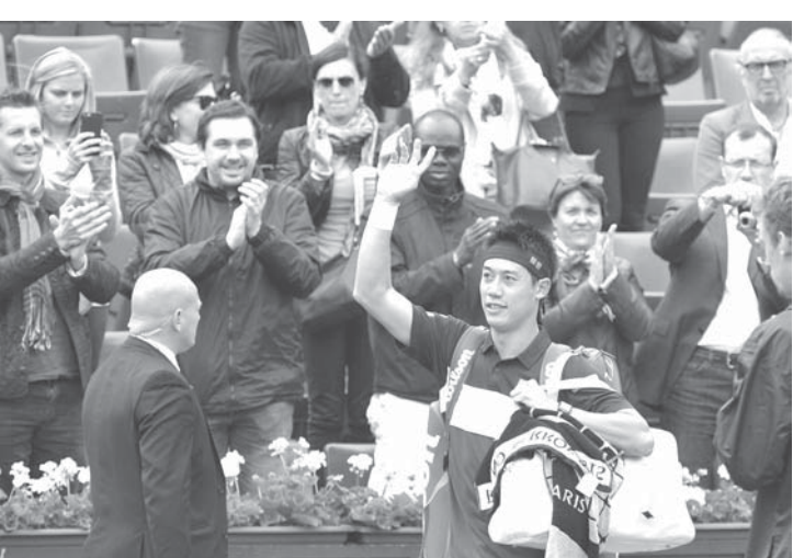
男子シングルス4回戦に勝利し、引き揚げる錦織圭

【パリ共同】テニスの全仏オープン第8日は5月31日、パリのローランギャロスで行われ、男子シングルス第5シードの錦織圭(日清食品)が全仏では初の四大大会では通算4度目のベスト8に進出した。準々決勝では第14シードのジョー・ワイルフリード・ツォンガ(フランス)と対戦する。錦織は4回戦でタイムラズ・ガバビリア(ロシア)にストレート勝ちし、日本男子では1993年に準決勝に進んだ藤次郎以来82年ぶりのベスト8入り。女子では95年、赤土のコートで奮闘した。