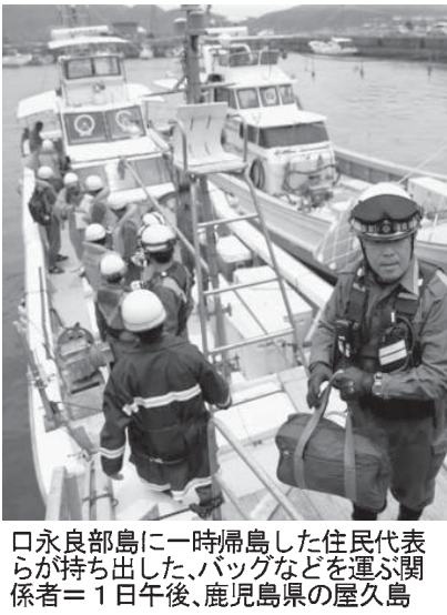
島帰りの2時間代表ら住民。島に上陸して各戸を巡回し、電化製品のコードを抜くなどの防火・防犯対策のほか、家畜の様子を確認した。5月29日の噴火による全員避難後、住民が島に入ったのは初めて。

【共同】口永良部島・新岳（鹿児島県屋久島町）の爆発的噴火で、屋久島に避難した住民の代表らが1日午前、口永良部島に最大2時間程度立ち入りした。自治体職員らも合わせた約30人が島に上陸して各戸を巡回し、電化製品のコードを抜くなどの防火・防犯対策のほか、家畜の様子を確認した。5月29日の噴火による全員避難後、住民が島に入ったのは初めて。