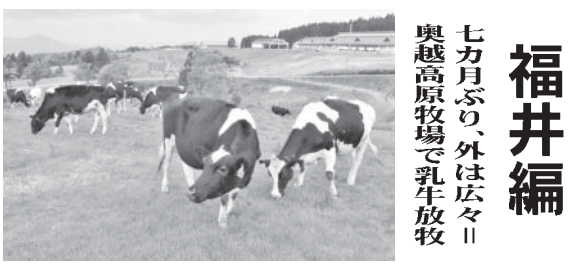
福井県奥越高原牧場で乳牛が放牧されている様子

【共同】岐阜県内唯一の養蚕産地、海津市で30日、小麦の収穫が始まった。黄金のじゅうたんのような畑に、コンバインの小さな煙が立ち上り、音の響く。JAにしみのによると、市内で栽培しているのは「イワイノダイチ」など3品種。作付面積は約1000ヘクタールで、県全体の3割を占める。同市海津町内記の畑では、内記地域営農組合の組合員らがコンバイン2台で手際よく刈り取り、トラックに移していた。