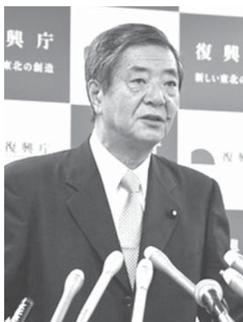
被災地負担に理解を求める竹下復興担当大臣

【共同】政府は3日、2016年度から東日本大震災の復興事業費の一部に1・0・3・3・3の地元負担を導入する案を発表した。20年度まで