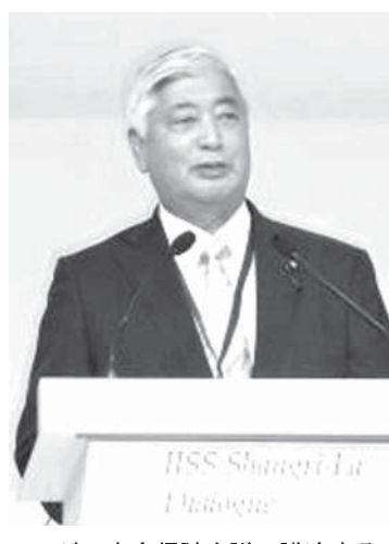
アジア安全保障会議で講演する中谷防衛相

【シンガポール共同】中谷元・防衛相は5月30日午前(日本時間同)、シンガポールで開催中の「アジア安全保障会議」で講演し、東南アジア諸国連合(ASEAN)諸国など関係各国による南シナ海の監視強化を提唱した。地域の飛行、航行の安全と自由を確保するための共通ルールの必要性も打ち出し、協力を呼び掛けた。中国が進める南シナ(英語名スプラトリー)諸島での岩礁埋め立てに警鐘を鳴らした。