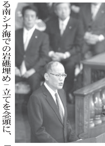
参院本会議場で演説するアキノ大統領

【共同】国賓として来日しているフイリピン・アキノ大統領は3日、参議院本会議場で演説し、政府が今国会での成立を目指す安全保障関連法案の