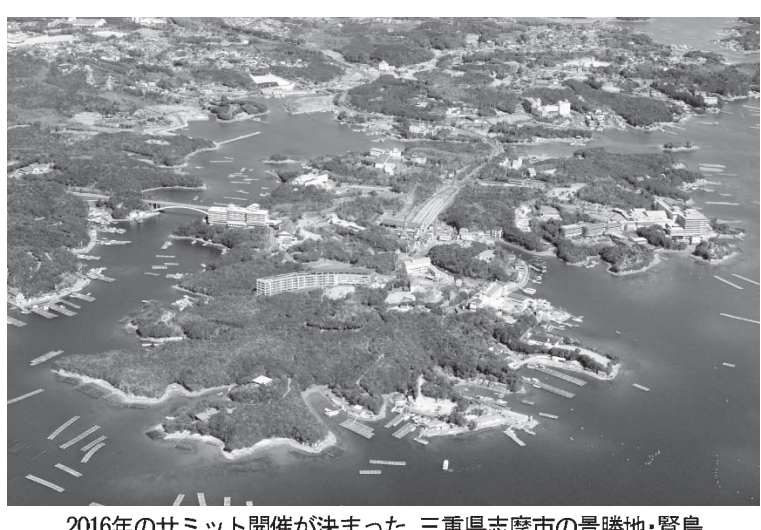
2016年のサミット開催が決まった、三重県志摩市の景勝地・賢鳥