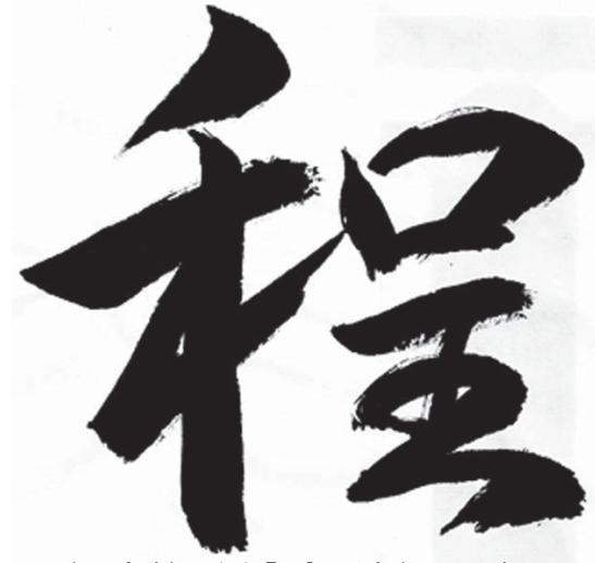
本因坊秀哉の色紙『程』より書き写したものと