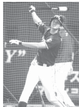
打撃練習する日本ハム・大谷

【共同】交流戦を終えたプロ野球は、セ、パ両リーグ内の対戦が19日に再開する。交流戦最高勝率チームで2位につけるソフトバンクは、0・5ゲーム差の首位日本ハムと本拠地ヤフオクドームで直接対決する。1分けを挟んで10連敗中のDeNAは、横浜スタジアムでの広島戦で連敗ストップを目指す。セ1位の巨人は東京ドームで中日と対戦する。ソフトバンクは、ロッテはQVCマリンフィールドに楽天を迎え、オリックスはほともっとフィールド神戸で西武と戦う。阪神とヤクルトは20日から甲子園球場で2連戦を行う。 セ・パ交流戦で最高勝率と好調のソフトバンクは、リーグ再開を控え、ヤフオクドームで約2時間の全体練習を行った。投手、野手とも談笑を交えながらリラックスした様子で汗を流し、主将の内川は「再開して約2時間という気持ち、現状でやりたいと思うところは全部でOK」と気を引き締めていた。 工藤監督は「1軍の練習途中に移動し、2軍戦を観察するなど積極的に動いてほしい」と動員を促している。