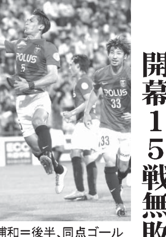
浦和レッズが開幕から15戦無敗でJ1首位を独走する浦和は、20日の神戸戦に挑む

開幕15戦無敗の独走浦和 浦和レッズは、開幕から15戦無敗でJ1首位を独走する。神戸は、20日の浦和戦に挑む。浦和は、開幕から15戦無敗でJ1首位を独走する。神戸は、20日の浦和戦に挑む。