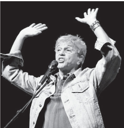
カエターノ・ヴェローゾ