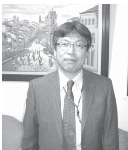
離任報告に訪れた佐野首席領事

在聖領事館の佐野浩明首席領事が離任するにあたり10日、あいさつのため来社した。小林雅彦・現ベレン領事事務所長の後を継ぎ、2011年10月から就任。2年8カ月の任期を振り返り、