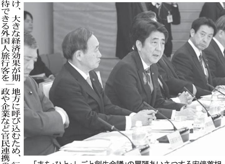
「まち・ひと・しごと創生会議」の冒頭あいさつする安倍首相