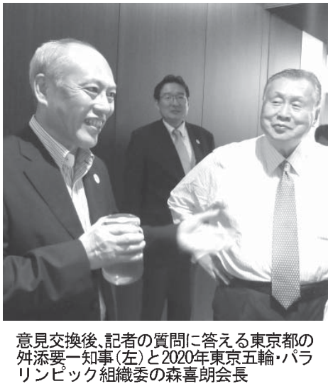
意見交換後、記者の質問に答える東京都の舩添知事（左）と2020年東京五輪・パラリンピック組織委員会の森喜朗会長

和田が今季初勝利 【共同】プロ野球は、セ、パ両リーグ内の対戦が19日に再開する。交流戦最高勝率チームで2位につけるソフトバンクは、0・5ゲーム差の首位日本ハムと本拠地ヤフオクドームで直接対決する。1分けを挟んで10連敗中のDeNAは、横浜スタジアムでの広島戦で連敗ストップを目指す。セ1位の巨人は東京ドームで中日と対戦する。ソフトバンクは、ロッテはQVCマリンフィールドに楽天を迎え、オリックスはほともっとフィールド神戸で西武と戦う。阪神とヤクルトは20日から甲子園球場で2連戦を行う。 セ・パ交流戦で最高勝率と好調のソフトバンクは、リーグ再開を控え、ヤフオクドームで約2時間の全体練習を行った。投手、野手とも談笑を交えながらリラックスした様子で汗を流し、主将の内川は「再開して約2時間という気持ち、現状でやりたいと思うところは全部でOK」と気を引き締めていた。 工藤監督は「1軍の練習途中に移動し、2軍戦を観察するなど積極的に動いてほしい」と動員を促している。