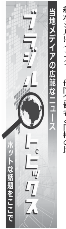
地中メテアの広範なニュース