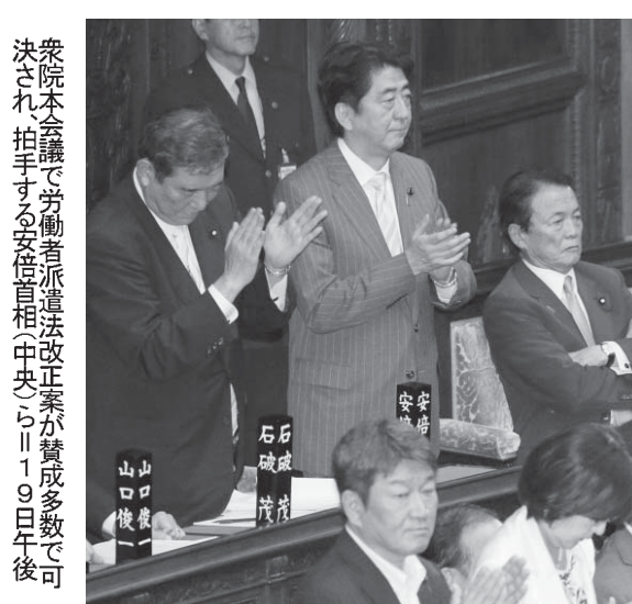
衆院本会議で労働者派遣法改正案が賛成多数で可決され、拍手する安倍首相(中央)ら。19日午後