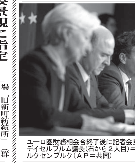
ユーロ圏財務相会合終了後に記者会見するルクセンブルク