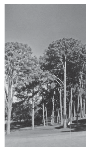
雑園の11番ホール(arujá golf clube 50 anos de história)

2年後に同志165人が集まり、互いに資金を出し合い、1965年6月29日に9ホールを完成させ、「アルジャゴルフクラブ」を立ち上げた。その後、徐々に会員を増やし1ホールずつ建設を進め、約10年という時間をかけ、現在のようないまのホールを完成させた。