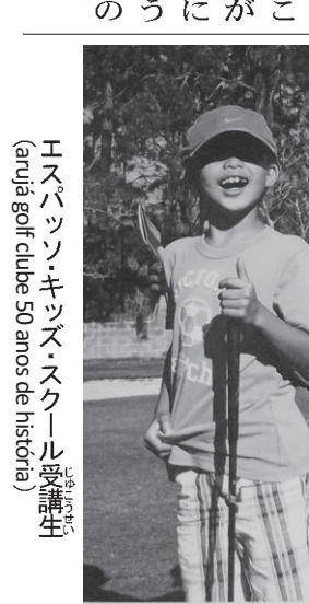
エスパソ・キッズ・スクール受講生(arujá golf clube 50 anos de história)

2年後に同志165人が集まり、互いに資金を出し合い、1965年6月29日に9ホールを完成させ、「アルジャゴルフクラブ」を立ち上げた。その後、徐々に会員を増やし1ホールずつ建設を進め、約10年という時間をかけ、現在のようないまのホールを完成させた。