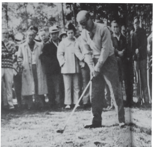
初期の大会の様子(arujá golf clube 50 anos de história)

その歴史は、1963年、「誰でも自由にプレーできる日系人のゴルフ場を作る」という夢を抱いた111人が、共に