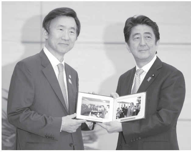
韓国の尹炳世外相(左)から晋太郎元外相の写真を手渡される安倍首相=22日午前、首相官邸

【共同】日韓外交正常化から22日で50年。安倍晋三首相が東京で関係改善への意欲を表明したのに対し、朴槿恵大統領はソウルで祝意を表明しながら、歴史認識問題への対応を促した。従軍慰安婦問題と竹島問題をめぐり対立は根深く、どちらの政府も「譲歩すれば国内から突き上げを受けかねない」（外交筋）のが実情だ。双方はジレンマを抱えつつ、次の50年へ向かう。