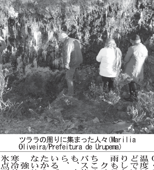
ツララの周りに集まった人々

今年度のエルニニョは比較的穏やかとの予想が出ており、大半の農家が胸をなでおろしている。エルニニョは太平洋の海水温が上がり、洋上の風の通路や各地の降水量、気温などに影響を及ぼす気象現象で、比較的影響が強かった2009-10年は、ブラジル南部や南東部で米などの収穫量が落ちる原因となり、農家の頭痛の種となっていた。