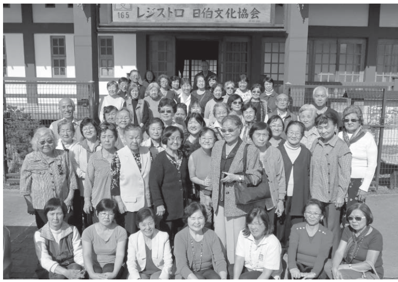
勉強会に集まった皆さん

最も伝統あるレジストロ農協婦人会(宇都宮市)の第50回「勉強会」が21日午前10時から同市文化協会館で行われ、会員を中心に50人余りが集まった。コチア産業組合中央会のレジストロ事業所の婦人会としていち早く発足し、カッポン・ポニートなど各地に統々と婦人会が創立するきっかけとなった。母体であるコチア産組が94年に解散した後、しっかりと活動を継続している。