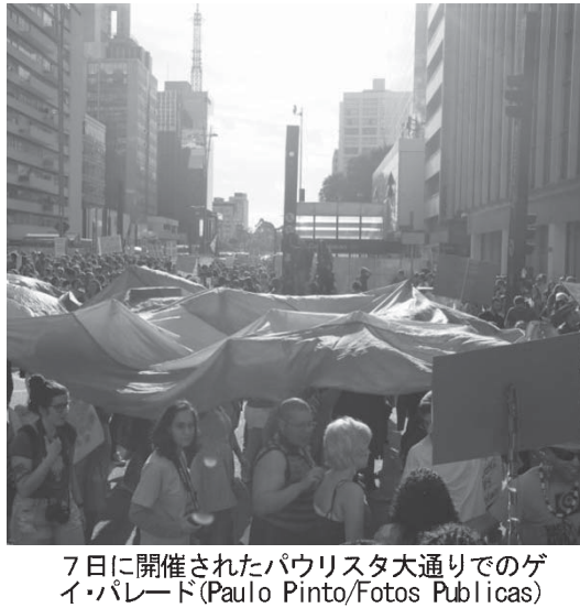
7日に開催されたパウリスタ大通りでのゲイパレード

区、モルンビの目と鼻の先にあるライゾーポリスに生きている2人の腹違いの姉妹を描いたノウエーラは、現在のブラジルは、若手人気スターの好演でわかりやすく描いていることで、好評を博している。6月22日、同局のノウエーラの放送期間は8カ月は続くのが基本だが、「パピロニア」がそのまま屈指の戦いを続けていくと、これまで通りの可能性もある。(23日付フォーリー紙サイトなどより、24日掲載)