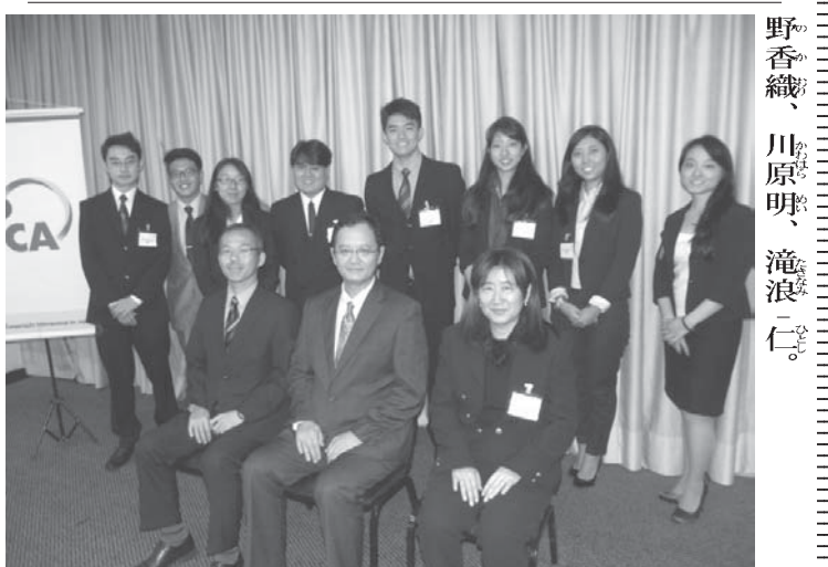
研修生と中前総領事(前列中央)ら

設立されたもので、大学生を対象として行うのは今回が初めて。研修生は横浜国立大学や東海大学の講義でプレゼンテーションや日本人学生とのディスカッション、研修旅行等を通して日本への理解を深める。出発直前となる29日には聖市リベルダーデ区