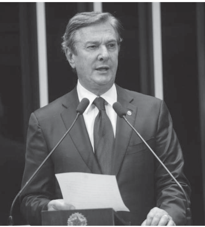
家宅捜査にあったコーロル元大統領