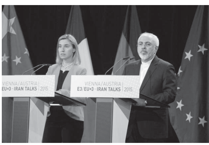
イラン核協議の最終合意後、記者会見するイランのザリフ外相(右)と欧州連合(EU)のモゲリーニ外交安全保障上級代表=14日、ウィーン

【ウィーン共同】欧米など6カ国とイランは14日、ウィーンでイラン核問題の外交解決に向け最終合意したと発表した。ウラン濃縮などのイランの核開発活動を最大15年制限し、濃縮率を3.67%に引き下げ、濃縮离心机の数を削減し、濃縮离心机の製造を禁止する。核兵器保有阻止に道筋を付ける歴史的な成果とされる。