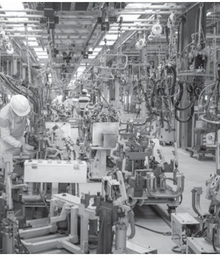
伯国でのチェリーの工場

だが、こうした流れに乗って国内生産に切り替えたメーカー各社の業績は、次第に深刻になりつつある。自動車不況の影響を受けて、期待されたような明るいものにはなっていない。