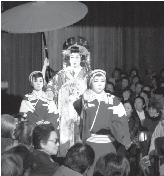
2011年5月、前回の文協公演で披露された、上野動物園から観客が撮った花魁姿の演出。

送付先=Editora Jornalística Uniao Nikkei Ltda Rua da Gloria, 332 Sao Paulo-SP CEP 01510-000 FAX(11) 3341-6476 E-mail cristiane@nipppak.com.br 以上、誠に恐縮ですが大至急お願い申し上げます。