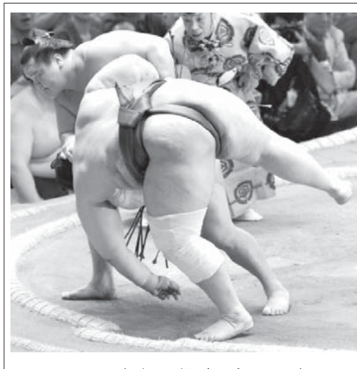
白鵬が上手投げで碧山を下す

【共同】大相撲名古屋場所5日目(16日)・愛知県体育館)2横綱が連続して5連勝した。白鵬は碧山を上手投げで転がし、鶴竜は小結紗義龍を冷静にはたき込んだ。新大関照ノ富士は関脇板垣山との全勝対決に土つかず投げで勝った。土つかずは平幕の鏡桜を含めて4人。