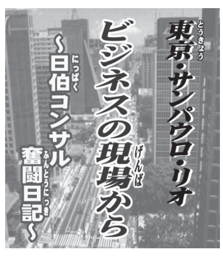
東京・サンパウロ・リオ