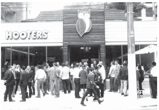
大勢で賑わうパウリスタ店の様子