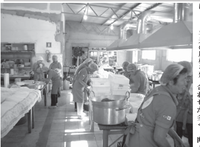
広くなった台所で婦人らが早朝から汗を流した

初日午前10時にはモンプツ墓地の「招魂」碑前で、恒例のカトリック式法要が行われた。約70人の参加者が215人の先没者を偲び焼香した。記念式典では、市の鼓笛隊が会場を盛り上げ、来賓が祝辞を述べた。外交120周年を祝し、市役所から贈られた記念プレートもお披露目された。