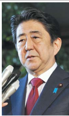
建設費17億を削減する見直しを正式表明した安倍首相。新国立競技場の建設計画見直しを正式表明した。官邸で記者団に「計画を白紙に戻し、ゼロベースで計画を見直す」と述べた。理由として「コストが当初の予定よりも大幅に膨らみ、国民から批判があった」と説明した。秋にコストの上限を含む新たな整備計画を策定し、20年春の完成を目指す。19年秋のラグビーワールドカップ（W杯）日本大会での使用は断念する。

【共同】安倍首相は17日、2020年東京五輪・パラリンピックのメインスタジアムとなる新国立競技場（東京都新宿区）の建設計画見直しを正式表明した。官邸で記者団に「計画を白紙に戻し、ゼロベースで計画を見直す」と述べた。理由として「コストが当初の予定よりも大幅に膨らみ、国民から批判があった」と説明した。秋にコストの上限を含む新たな整備計画を策定し、20年春の完成を目指す。19年秋のラグビーワールドカップ（W杯）日本大会での使用は断念する。