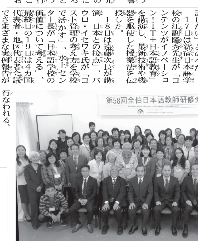
第58回全伯日本語教師研修会