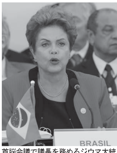
首脳会議で議長を務めるジウマ大統領

ルグアイ、パラグアイの 4カ国で始まった。20 12年にベネズエラが正 式加盟して5カ国となっ たが、ボリビアやチリ、 コロンビアなど7カ国が 準加盟国、メキシコは ニュージージーランドがオブ ザービーとなつている。 ボリビアの加盟は12 年に承認されたが、その 時はパラグアイが資格停 止中だったため、再度 正式加入のための手続き が取られた。他の3カ国 は既に会議の承認も取り 付けているため、伯国と パラグアイの議会が承認