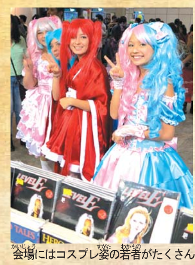
会場にはコスプレ姿の若者がたくさん

「アキバ・スペース」では連日コスプレ愛好家たちが集い、日曜(午後7時半から)には日本で開催される「世界コスプレサミット」の伯国代表審査会が行なわれる。土曜(午後6時半)の「ミス・ニッケイコンテスト」では全伯の予選を勝ち抜いた候補者たちがそれぞれの美を競い合う。盆踊り会場では終日、盆踊りや各日系団体による太鼓、ダンスが披露される。今年「アキバ・デ・オウロ」のサンパの実演も加わる。「高齢者の広場」ではゲートボールや健康に関わる企画が催され、「文化コーナー」では書道や絵手紙、折り紙のワークショップが催され、幅広い年代が楽しめる内容となっている。その他各県人会による「郷土食広場」の詳細は