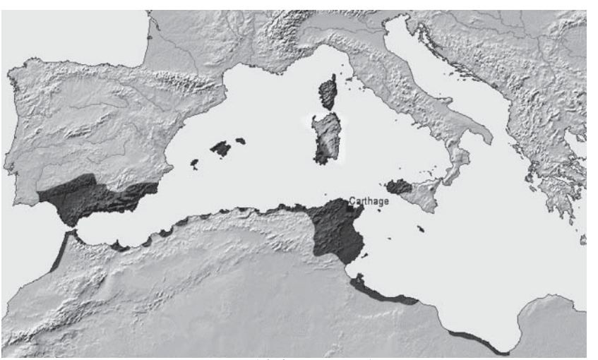
カルタゴ勢力範囲(紀元前264年頃、黒色部分)