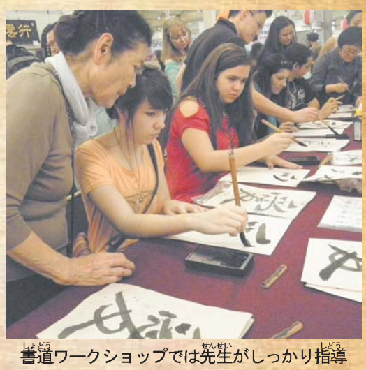
書道ワークショップでは先生がしっかり指導

入場券は現在、各所で販売中。前売り15レアル、当日18レ。65歳以上、8歳以下入場無料。ジャバクアラ駅から無料バスが出る。詳細の問い合わせ、申し込みは県連(11-3277-6108/11-3277-8569/www.festivaldojapao.com)まで。