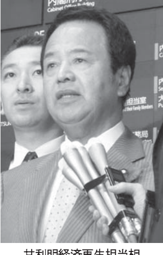
甘利明経済再生担当相

【共同】政府の経済財政諮問会議が22日開かれ、内閣府は2020年度の国と地方の基礎的財政収支が約6兆2千億円の赤字になるとの中長期財政試算を示した。今年2月時点の試算より約3兆2千億円改善するが、政府が目標に掲げる20年度の黒字化には届かない。16年度の成長率は実質1.7%程度、名目2.9%程度とする政府の経済見通しも示された。