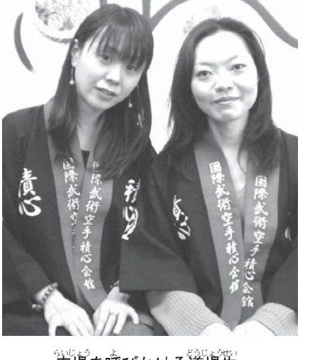
来場を呼びかける道場生

森山道場(森山雅和師範)は今週末の第18回日本祭り、0.5歳から15歳児を対象にした小児喘息の広場(Espaco da