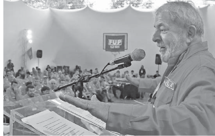
オデブレイトでの疑惑がさらに深まったルーラ氏

米国の南米諸国においている大使館が国務省に報告している外交機密文書が、ウイキリークスによって暴露された。それには、ルーラ大統領の第2期政権中、オデブレイト社が各国で賄賂や汚職に絡んでいたことなどがわける記述がある。在エクアドル米国外使館は、同国のラファエル・コリア大統領が表向きには契約不履行を理由にして、伯国企業オデブレイトとベトロラスを追放すると脅している。その裏には賄賂の疑惑があると2008年10月21日付けの外交電文で報告している。同国マナビ県の灌漑施設についてのオデブレイト社が出した契約書に