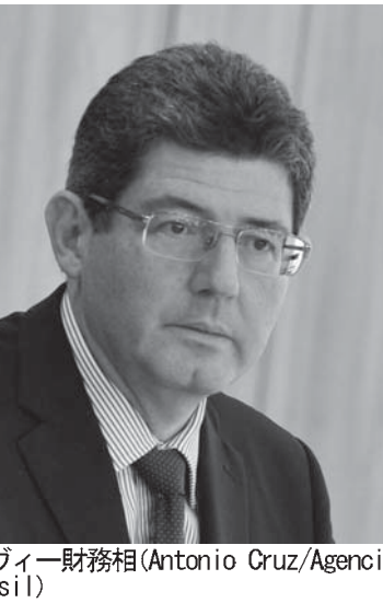
レイヴィー財務相

（ただしエスタド紙は約0.2%と報道） 21日より、レイヴィー財相は政府が財政調整の方針変更を行う事を示唆しており、「税収、景気動向が予測以上に悪化している」との報告書が上がっている。これに対処するため、より現実的な目標が必要だ」と述べ