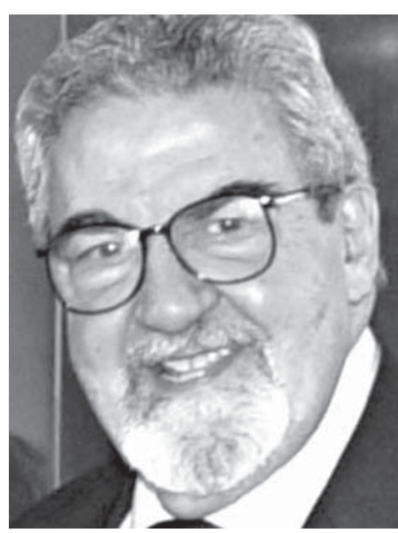
元リオ市長のコンデ氏

1997〜2000年までリオ市長をつとめたルイス・パウロ・コンデ氏(80)が、21日未明入院先のリオ南部ブラジリアン市のサンジョアキン病院で前立腺癌のために死去した。22日付付字紙が報じている。 国立ブラジル大学建築科、現・リオ連邦大学建築科