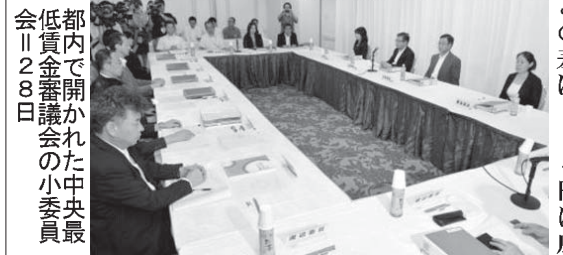
都内で開かれた中央最低賃金審議会の小委員会。28日。

【共同】厚生労働相の諮問機関である中央最低賃金審議会の小委員会は29日、2015年度の地域別最低賃金の改定について全国平均の時給で18円引き上げ798円とする引き上げをまとめた。目安通り引き上げられれば、14年度の16円増を2円上回り、02年度に現在の方式になって以来、最大の引き上げ幅となる。景気回復傾向を反映したことに加え、安倍政権が大幅な引き上げに意欲的なことも影響。2桁の引き上げは4年連続で、東京、神奈川では初めて900円台となる。最低賃金は都道府県ごとに決められ、小委員会が示した各地の上げ幅の差は、Aの16円とDの18円の間。労働代表らが参加する小委員会は28日午後から取りまとめに向けた審議を開始。徹夜の協議の結果、都道府県を経済規模などに分けてAからDの4ランクに分類して示す引き上げ額の目安は、東京、神奈川などのAは19円、静岡などBは18円、岡山などCと青森などDはともに16円となった。B、C、Dの上