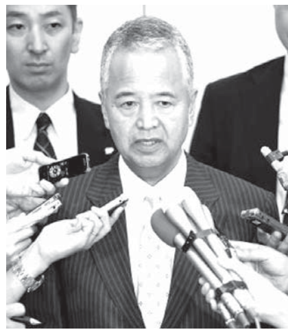
羽田空港で記者団の取材に応じるTPP相

【ワイン】日本が輸入のポルトワインにかけられる関税は現在、価格の15%か1リットル当たり125円のうち低い方に設定されている。米国などとの協議では、これを7年かけて段階的に減らし最終的に撤廃する方向となっている。