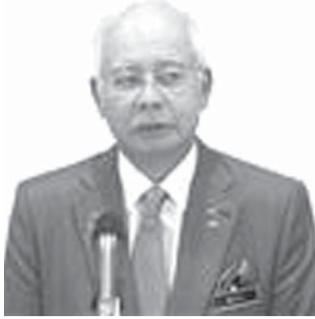
閣改造人事を発表したナジブ首相

首相は28日、政府系ファンドの資金流用疑惑をめぐるナジブ氏に説明責任を果たすよう求めた。政権ナンバー12のムヒディン副首相の交代を含む閣内改組人事を発表した。事実上の解任とみられる。