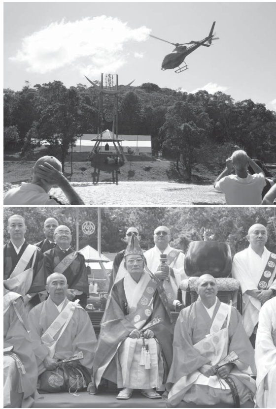
水しぎを巻き上げながら、ヘリコプターから開眼法を行なった(下) 記念撮影する僧侶ら。中央が山内上人。その右隣がコレイア教区長