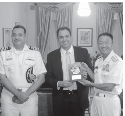
カマラ知事(中)と記念品を交換する中畑司令官(右)。

今回の練習艦隊の概要、レンフェでの活動予定、日伯間における防衛交流の状況等に関する説明や意見交換を行い、記念品を交換、親睦を深めた。同日夜には中畑司令官と梅田駐伯大使、日本国大使の共催で、かしま艦上レセプションが開催された。