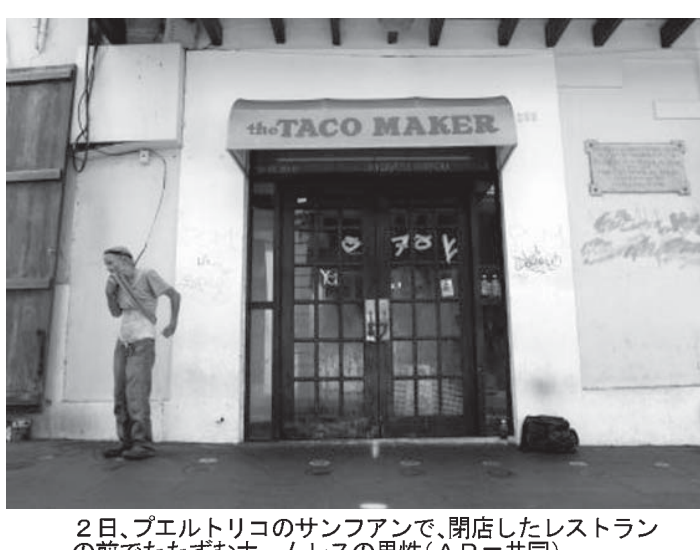
2日、プエルトリコのサンファンで、閉店したレストランの前でたずむホームレスの男性

米自治領で初、市場に悪影響が 政府系、債券償還できず 【ニューヨーク共同】米自治領プエルトリコの政府系企業が満期を迎えた債券について一部は償還できなかったことが3日分かった。米大手格付け会社ムーディーズ・インバスターズ・サービスはプエルトリコ（債務不履行）と認定した。米紙ウォールストリート・ジャーナル（電子版）によると、米自治領のプエルトリコは初めて、市場に悪影響を与える可能性がある。 （ニューヨーク共同）米自治領プエルトリコの政府系企業が満期を迎えた債券について一部は償還できなかったことが3日分かった。米大手格付け会社ムーディーズ・インバスターズ・サービスはプエルトリコ（債務不履行）と認定した。米紙ウォールストリート・ジャーナル（電子版）によると、米自治領のプエルトリコは初めて、市場に悪影響を与える可能性がある。