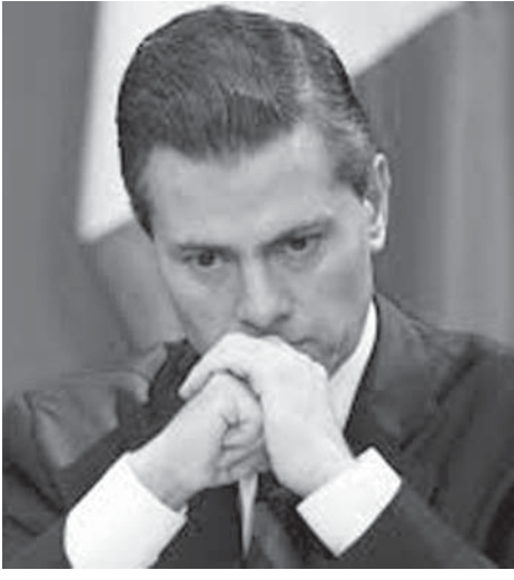
メキシコのニエト大統領

メキシコ政府が7月23日に発表したデータによると、同国では2012年から2014年にかけて200万人以上の国民が新たに貧困層に転落しており、貧困撲滅を掲げる同国のエンリケ・ペーニャ・ニエト大統領にとっては、公約達成になお大きな課題を抱えていることが示された格好だ。