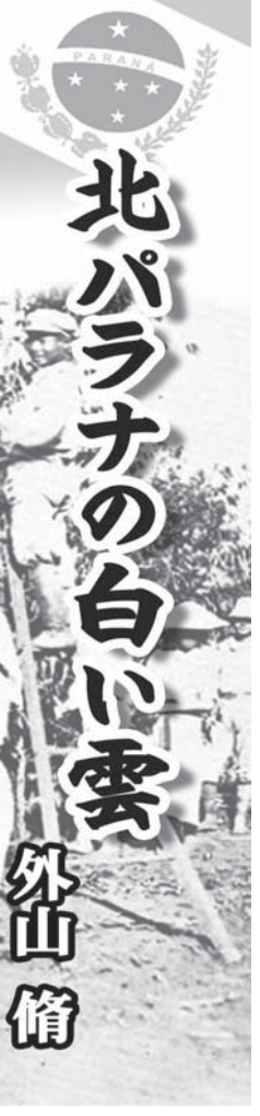
北パラナの白い雲 (21)