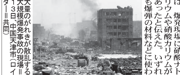
大量のけがれが散らばった天津市の爆発現場

【天津共同】中国天津市の物流拠点「滨海新区」にある化学物質の倉庫で12日午後11時半（日本時間13日午前0時半）ごろ、大規模な爆発が2回発生した。同市当局によると、50人が死亡した。700人が入院、うち70人が重体という。消防士など数千人が行方不明になっている。滨海新区は中国政府が重点的に経済開発を進めている地区の一つで、進出している日本企業も多い。日本の大手スーパーや自動車メーカー販売店のガラスが割れて営業を停止。多くの日系企業に被害が出た。習近平国家主席は原因究明や救助活動に全力を挙げよう指示。当局は関係者を拘束した。