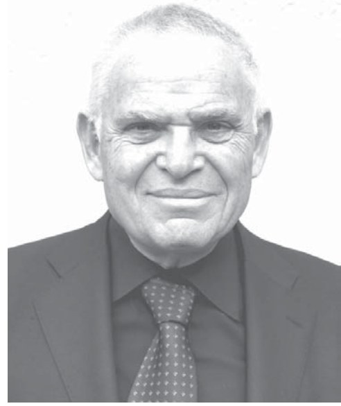
エドワード・ルトワック氏。アメリカ合衆国の歴史学者で専門は軍事史、軍事戦略研究、安全保障論

「AIIB」(アジアインフラ投資銀行)の設立は、日本がアメリカと一緒に戦える「道が開けること」になります。