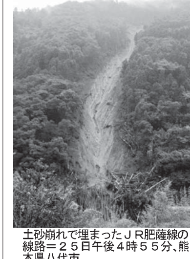
土砂崩れで埋まったJR肥後線の線路。熊本県八代市

【共同】強い台風15号は25日午後、日本海を北上した。次第に勢力を弱めるが、台風に向かって湿った空気が流れ込むため、西日本から東日本は26日にかけて大気不安定になる。気象庁は土砂災害や浸水、河川の増水に警戒を呼び掛けた。 熊本県芦北町では25日未明、軽トラックを運転していた男性(70)が前方不明になった。土砂崩れに巻き込まれた可能性があり、負傷者は九州や中国、中部などで75人以上となった。JR九州の在来線や九州新幹線、山陽新幹線の一部区間で始発から運転を見合わせた。午後には再開。空の便は、西日本の各地を発着する便を中心に、全日空の約100便、日航の約130便が欠航した。 気象庁によると、25日午後3時30分までの24時間予想雨量は、いずれも多い所で東海250ミリ、近畿150ミリ、日本や東海は26日明け方にかけて非常に強い雨が降り、予想される最大風速は九州北部、四国25メートル(最大瞬間風速35メートル)、東海23メートル(同35メートル)。海上も大波が続き、波は九州北部から中国、四国、近畿、東海にかけて6メートルの見込み。