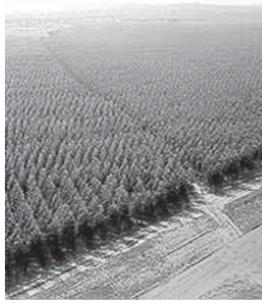
ペルナンブッコ州のユーカリ林

サトウキビ畑の面積の半分以上の面積が非常に起伏に富み、非効率なため、北東部のサトウキビ・プランテーションで、こうした傾斜地で利用できる代替作物の開拓を進めている。