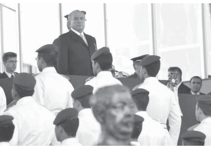
25日のテメル副大統領