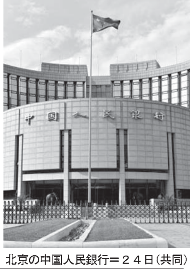
北京の中国人民銀行=24日(共同)

【北京共同】中国人民銀行は25日夜、世界で続いた株安の連鎖に対応するため、0.25%の緊急の追加利下げに踏み切ると発表した。同時に預金準備率も引き下げる異例の追加金融緩和となる。景気減速への危機感を背景に、世界市場の安定に向けて政策発動する。この日は東京株式市場で6月半ばぶり、上海でも約8カ月ぶりの安値を付けた。取引終了後の利下げ発表を受け、欧州では上昇基調を強めた。