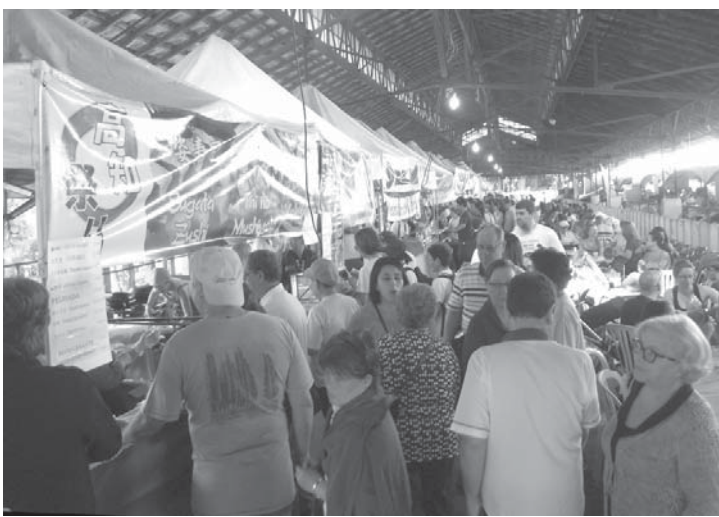
開場いっぱいのお客さん