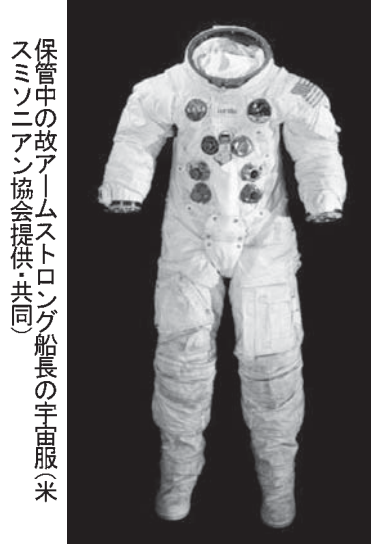
保管中の故アームストロング船長の宇宙服

【ワウル共同】韓国と北朝鮮は25日未明(日本時間)、南北軍事境界線のある板門店で22日から続けていた高官会談を終了、韓国領で起きた地雷爆発に北朝鮮が「遺憾」の意を表明し、緊張緩和で合意した。 韓国は25日正午に北朝鮮向けの拡声器を使った宣伝放送を中止するとともに、共同報道文を発表した。北朝鮮は前線地帯に宣言していた「準戦時状態」を解除する。南北は「遺言」の意を表明し、緊張緩和で合意した。 さらに南北は関係改善のための当局者会談をソウルが平壤で早期に開催するほか、9月の中秋に合わせた南北離散家族再会へ向け赤十字間の協議を行うことでも合意した。