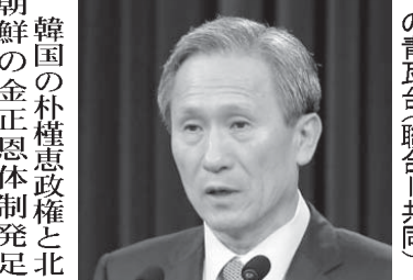
北朝鮮との合意について公表する韓国国家安保委員長(右)とソウルの青瓦台

北朝鮮の金正恩体制発足後、双方が関係改善の努力をうたう合意を交わしたのは初。衝突の危機は当面回避された。 韓国軍は25日正午、宣伝放送を中止した。韓国国防省関係者が明らかにした。 ただ20日の韓国領への砲撃に関する責任問題、安保の記者会見で緊張は「收拾した」と表明。北朝鮮からは「不正常事態が生じない限り、韓国は宣伝放送をやめると宣言した」と強調した。北朝鮮は、北朝鮮の挑発に断固対応するとの原則を貫く一方、解決に向けて努力した結果だ」と述べた。 報道文は「不正常事態が生じない限り、韓国は宣伝放送をやめると宣言した」と強調した。北朝鮮は、北朝鮮の挑発に断固対応するとの原則を貫く一方、解決に向けて努力した結果だ」と述べた。