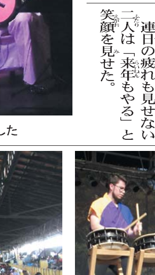
別日の単独公演でも人気を博した