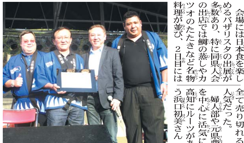
感謝状を受け取る片山会長と飯屋下議（左から2番目から）