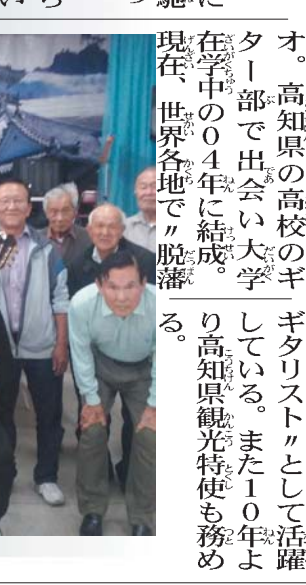
県人会員と記念撮影