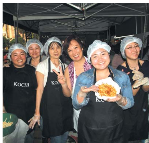
活気溢れる！婦人部の皆さん