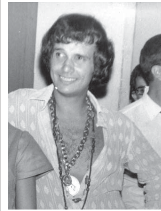
アイドル時代のロベルト・カルロス

エラスモは「現にカエタノの代表曲(『ロペルケ・ヴァン・トウード・ブナ地獄へ行つてしまえ』)が、あの頃のどのプロデューサーよりも若者に大きな意味を持っていた、と言っていたらいいから」と語っている。