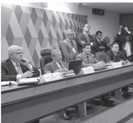
諮問会でのジャノ-氏(左側写真手前)と氏に質問するコーロル元大統領(右側写真手前)

ジャノ-長官の再任は、諮問会後に行われた本会議での投票で、賛成59、反対12、棄権1で承認された。上院にはラヴァ・ジャノ-で捜査リストにあがった議員がレナン・カリエロス議長をはじめ13人いたことが懸念材料になったが、そのことは命取りとはならなかった。