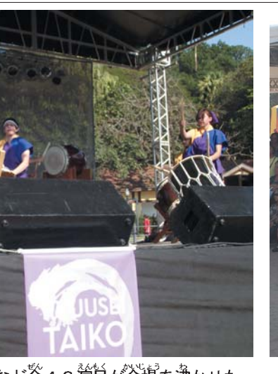
太鼓やダンスなど全43演目が会場を沸かせた