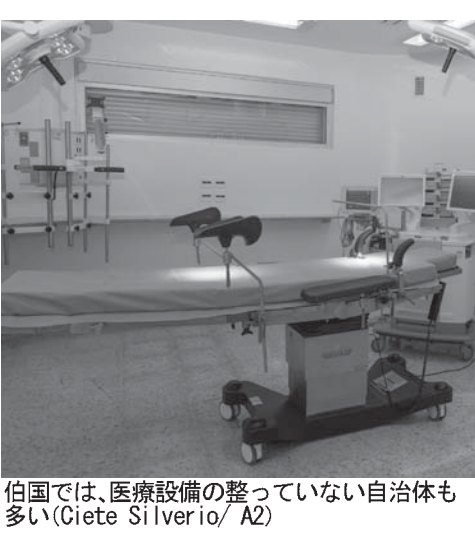
伯国では、医療設備の整っていない自治体も多い

伯国全5570の自治体(市)の内、52%にあたる2902の自治体では、医療設備が整わないため、検査をするために他の自治体に送られている。この傾向は人口5万人までの市や、南東部、北東部で顕著だ。同調査では、24時間