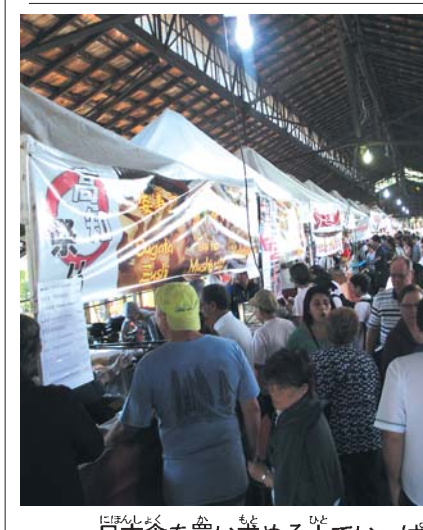
日本食を買い求める人でいっぱい