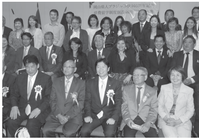
105周年を祝う伊原木知事(前列中央)と関係者

岡山県人会(根岸健三会長)が23日、岡山県人移住105周年を祝って、聖市のグローバルシティホテルで記念式典を行った。伊原木隆太郎知事、小野泰弘県議会議長および県議会議員等を含め16人の慶祝団を迎え、移住から一世紀を越えた節目を祝った。