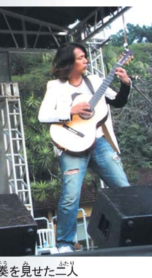
卓越した演奏を見た二人