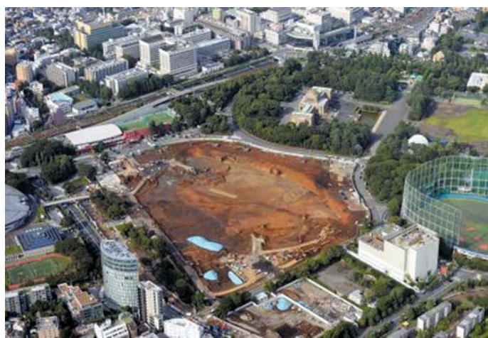
2020年東京五輪・パラリンピックのメインスタジアムとなる新国立競技場の建設予定地=7月、東京都新宿区