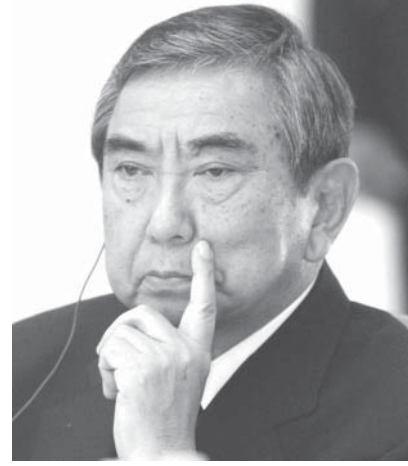
河野洋平氏、2006年撮影