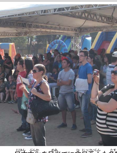
日本文化を目標に非日系人も多数来場