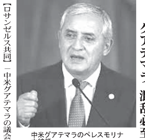
中米グアテマラのベレスモリア大統領

【ロサンゼルス共同】中米グアテマラの議会は1日、汚職事件への関与が指摘されているベレスモリア大統領の不逮捕権を剥奪することを決めた。同国メディアなどが報じた。汚職事件では前大統領ら約30人が逮捕されているが、大統領に司直の手が伸びる可能性がある。政治的混乱は必至だ。