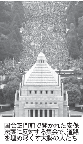
安道たち、会場の入り口で待機中

【共同】先月30日に国会周辺で開かれた安全保障関連法案反対の集会に参加した約12万人、主催者の発表によると、実際は約3万人と推定された。主催者は約12万人と発表したが、警視庁の発表によると、約3万人と推定された。主催者は約12万人と発表したが、警視庁の発表によると、約3万人と推定された。