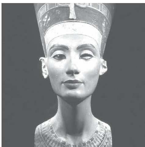
ベルリン博物館蔵のネフェルティティ王妃の胸像

【共同】先月30日に国会周辺で開かれた安全保障関連法案反対の集会に参加した約12万人、主催者の発表によると、実際は約3万人と推定された。主催者は約12万人と発表したが、警視庁の発表によると、約3万人と推定された。