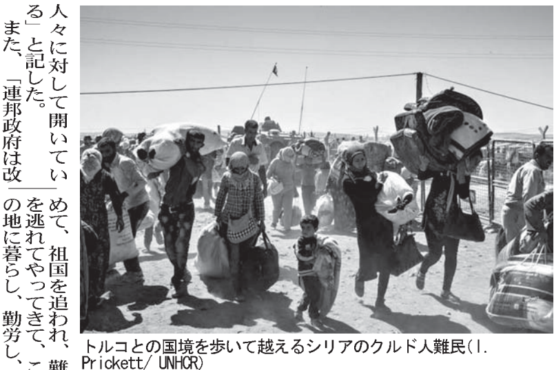
トルコとの国境を歩いて越えるシリアのクルド人難民

アルチワニさんは機械技師としての職を得る事ができず、妻とシリア料理を売る屋台を始めた。二人は現在、聖市にシリヤ料理店を開くために貯金している。今世界は、第2次大戦以降最大の難民発生国の危機に瀕している。国際