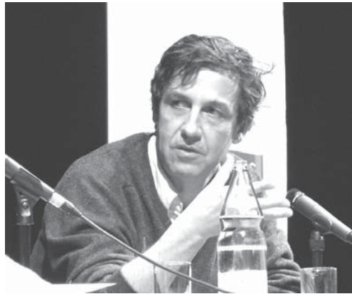
フランスの人口学・歴史学・家族人類学者エマニュエル・トッド氏