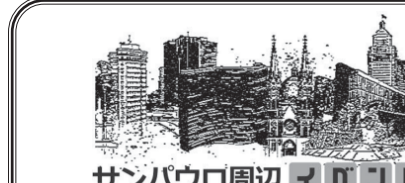
サンパウロ周辺情報