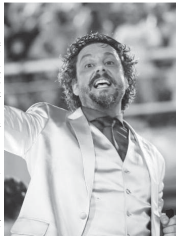
主演の「アレグラ・ド・ジョーゴ」のタタ・バレット(Tata Barreto)

8月31日、伯国最大テレビ局、グローボの最高視聴率時間帯の「9時のノヴェーラ」で、新番組「アレグラ・ド・ジョーゴ」(「ゲームの規則」の意)がスタートした。