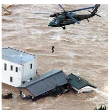
鬼怒川は10日未明から順次、栃木、茨城各県に特別警報を出した。大雨で鬼怒川が氾濫し、茨城県常総市で約100人が救助された。鬼怒川が氾濫し、茨城県常総市で約100人が救助された。

【共同】台風18号の影響による大雨で関東や東北では10日も記録的な豪雨が続き、茨城県常総市では鬼怒川が氾濫した。常総市は「9人が行方不明になっている」と明らかにした。ほかにも人が流されたとの情報も複数あり、安否の確認を進めている。警察庁によると、堤防決壊で周辺の約100棟が浸水、警察や消防、自衛隊、海上保安庁は同日夜までに、取り残された周辺住民ら約200人をヘリコプターなどで救助した。