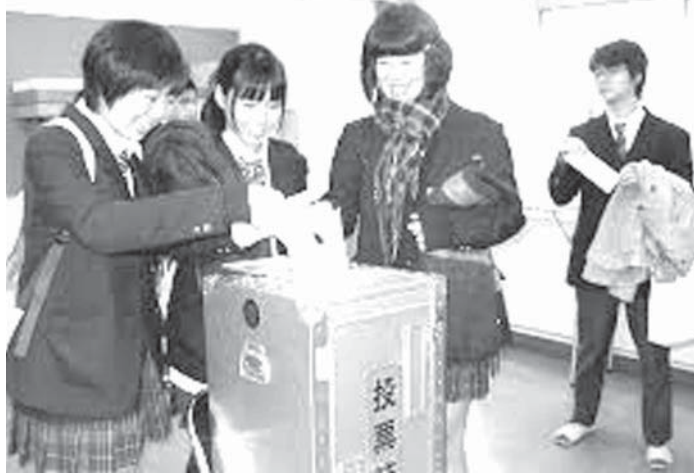
模擬投票をする高校生ら

【共同】来年の参院選からの18歳選挙権実現をにらみ、高校生の政治活動や選挙運動のあり方をまとめた文科省の学校現場に対する新通知案が14日、判明した。校内の政治活動は原則禁止するが、校外では一定の条件下で容認する。主権者教育に際し、教師が個人的な主義や主張を述べるのを避けるよう求め、公正中立な立場での生徒指導を要請する。通知見直しは46年ぶりとなる。