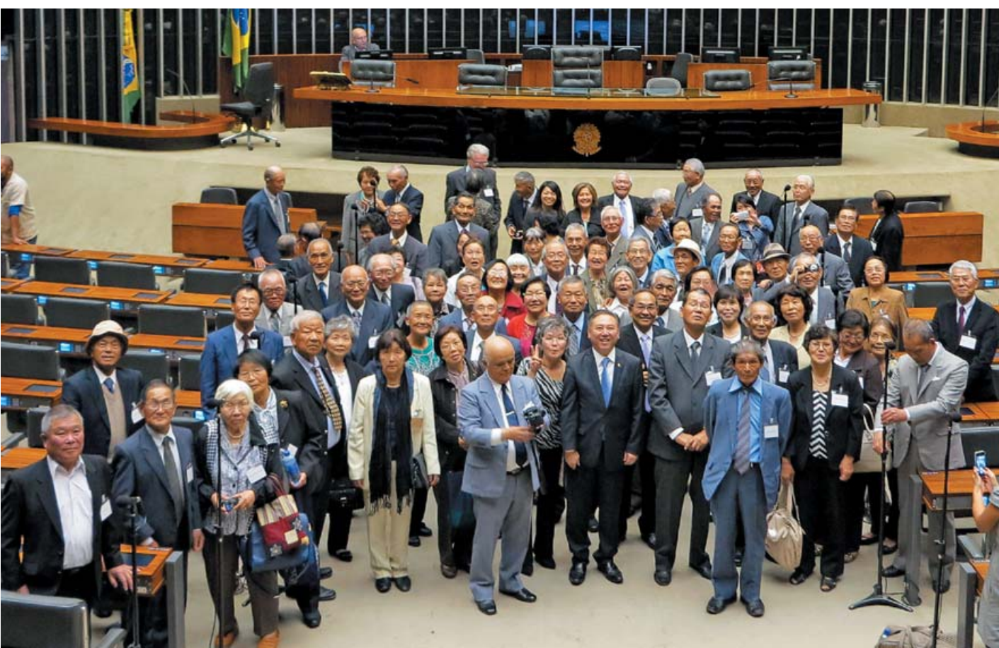
式典後に連邦議院内で記念撮影

午後2時過ぎ、首都の連邦議会のネレウ・ラモス講堂で式典が始まった。飯星下議が登壇して開会、日伯国歌を