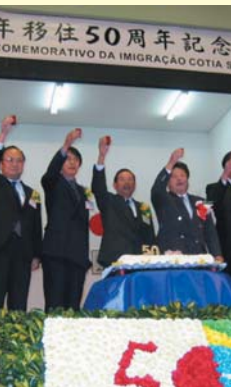
コチア青年移住50周年記念式典 半世紀の節目を乾杯で祝福

「コチア青年ファミリーの祭典」 混合期にコチア産業組合と全農協同組合中央会との業務提携により、コチア青年は誕生した。農家の18歳から25歳までの独身青年、これは今昔、類例のない斬新な移住形態の試みの始まりで、日伯双方で注目を浴びた。