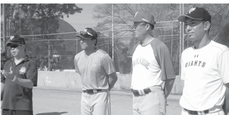
指導に臨む平岡から伊沢、玉木、黒田、平岡さん、クイアバではW杯で使用したアレノ・パンターノールで贈られた

同アカデミーはJICAと連携し、国外での日本式野球の普及を図っている。今年2月には、外樹立80周年を記念し、コスタリカでもセミナーを行なった。