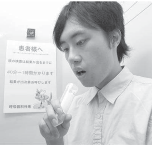
容器にたんを出し、顕微鏡で結核菌の有無を調べる喀痰検査

【共同】結核を過去の病気と思つたら大間違いだ。2009年には約2万4千人の結核患者が新たに発生。国内の感染者数は約2600万人との推計もある。