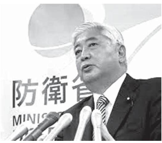
「新しい分野は装備、訓練も通じて、しっかりと（自衛隊を）出さなければいけない」と記者団に表明した中谷元・防衛相

【共同】政府は安全保障関連法成立を受け、自衛隊が武器使用できる状況や手順を厳密に定めた部隊行動基準（ROE）の見直しに着手した。自衛隊が平時から米艦などを護衛する「武器使用機会の増大」に備え、隊員が現場で武器使用の際に判断に迷わないよう、新たなROE策定が必要と判断した。年内をめどに決定する方針だ。関係者が19日明らかにした。