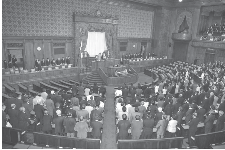
安保関連法が可決、成立した参院本会議=19日午前2時18分

【共同】歴代政権が禁じてきた集団的自衛権の行使を可能にする安全保障関連法が19日未明の参院本会議で、自民、公明両党などの賛成により可決、成立した。自衛隊の海外活動が地球規模に拡大し、戦後の安保政策が大きく転換する。民主、維新、共産などの野党は18日に内閣不信任決議案を衆院に共同提出し、参院には民主党が安倍首相の問責決議案などを提出。法案を「憲法違反だ」と訴え、成立阻止へ長時間の演説などで抵抗したが、いずれも与党などの反対多数で否決された。