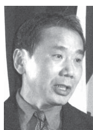
村上春樹さんが高い人気を誇るノーベル賞受賞者

【ロンドン共同】世界最大規模のブックメーカ（賭け屋）、英ラドブロックスは20日まで、10月に発表されるノーベル文学賞受賞者を