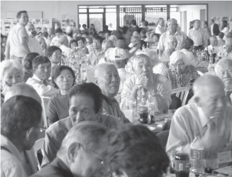
式典に参加したコチア青年とその家族