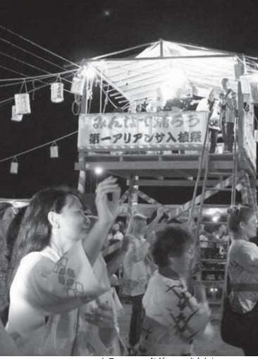
やぐらを囲んで踊る参加者ら

アリアンサ文協婦人部運動会が開かれ、第1アリアンサから若者男女が集ってさらに交流を深めた。