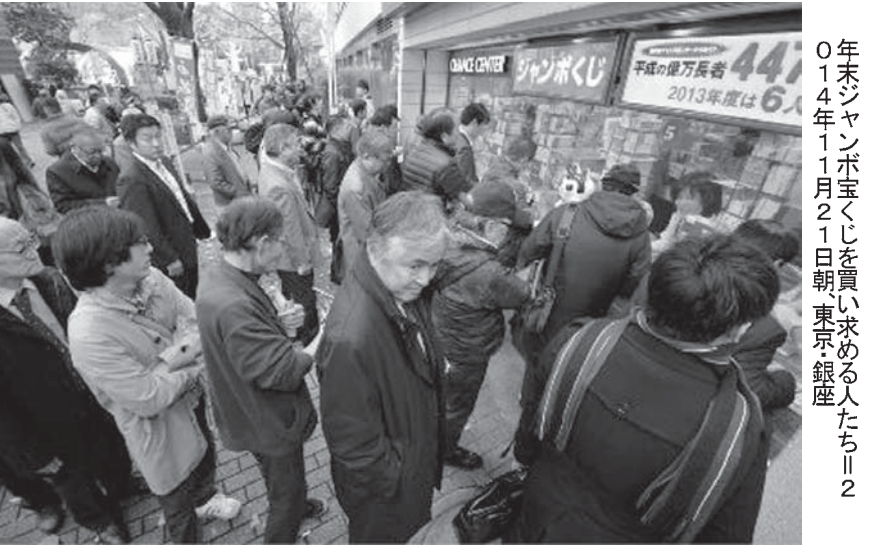
年末ジャンボ宝くじを買い求める人たち(2014年11月21日朝東京銀座)

【共同】今冬に発売される年末ジャンボ宝くじの1等と前後賞を合わせた賞金額が過去最高の10億円に引き上げられることが11日、分かった。宝くじの売り上げは、7億円の初めに10億円の大台に乗る。宝くじの売り上げは、サッカーくじとの競合や