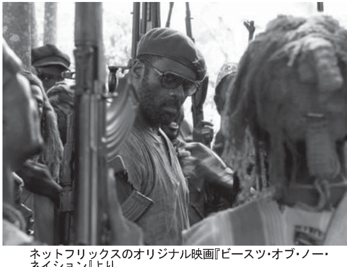
ネットフリックスのオリジナル映画「ピース・オブ・ノー」のシーン

【ベネチア共同】第72回ベネチア国際映画祭(9月2〜12日)は、金獅子賞を競うコンペティション部門に、映画制作の初稿「ピース・オブ・ノー」(米国のキヤノン・フィルム社)が出品された。この作品は、ネットフリックスによって製作された。舞台はアフリカの架空の国。内戦で家族を殺された少年が武装組織に拾われ、殺りく手に染められていく過酷なドラマだ。同社は本作をネットフリックスの映画館で公開することをいす。映画館から観客がベネチア国際映画祭