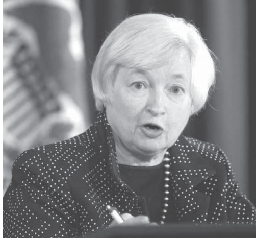
「FOMCの大半の参加者は年内の利上げが適切だと考えている」と述べたイエレンFRB議長

【共同】米国の中央銀行である連邦準備制度理事会（FRB）は17日の連邦公開市場委員会（FOMC）で、焦点だった政策金利の引き上げを見送り、事実上のゼロ金利政策を維持した。雇用情勢の改善が不十分で、世界経済の先行き不透明感や市場の混乱が米景気に与える影響を警戒する必要があると判断した。イエレンFRB議長はFOMC後の記者会見