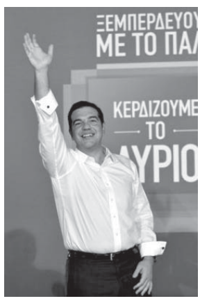
支持率20%で与党第1党に選出されたギリシャの政治家

連立交渉や組閣作業に着手。22日にも新政権が発足する見込みだ。SYRIZAは第1党に与えられる「ポニナス議席」の50を加え、推定145議席を獲得。単独過半数に届かず、独立ギリシャ人党(10議席)との連立維持を表明した。過半数議席を確保したことで政治混乱は回