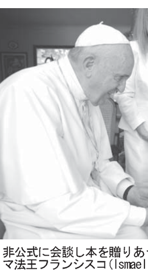
非公式に会談し本を贈りあう、F・カストロ元議長とローマ法王フランシスコ

19日、キューバを訪ねたローマ法王は、ラウル・カストロ議長と面会し、米国の関係改善のための努力を要請した。米国の関係改善への努力を要請した。米国の関係改善への努力を要請した。米国の関係改善への努力を要請した。