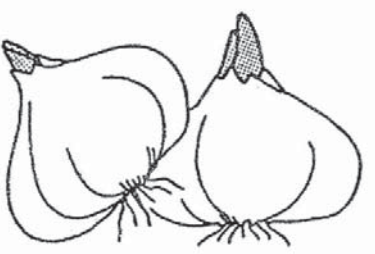
にんにくイラスト

【共同】指揮者の小澤征爾が総監督を務める音楽祭「セイジ・オザワ松本フェスティバル」と名を改め、新たなスタートを切った。小澤は骨折でオザワ3公演を降板したが、2公演でオーケストラを指揮して聴衆を魅了。降板による混乱はなかったが、圧倒的存在ゆえに、不測の事態への対応など運営面の課題が浮き彫りになった。 「世の中というものは、そういうものであることを改めて悟った。後日、取材協力者の一人が、当人に連絡をとってくれ、一度はエンタレヴィスタに登場するという返事を貰ったが、結局実現しなかった。