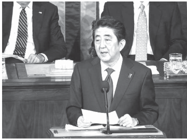
アフリカの平和と安定に積極的に貢献していく考えを示した安倍首相

【ニューヨーク共同】安倍首相は26日(日本時間27日)、米ニューヨークの国連本部で、アフリカ地域経済共同体の議長国首脳会合に出席し、テロ多発やエボラ出血熱の流行に直面するアフリカの平和と安定に積極的に貢献していく考えを示した。ケニアで2016年に開催する「第6回アフリカ開発会議」(TICAD)の成功に向けた意欲もアピールし、国連外交を本格化させた。