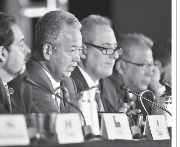
TPP交渉が関係国代表で5日、米アトランタ

前回の記事にも書いたが、中国はアフリカ大陸の紛争解決に、国連平和維持軍の兵力と資金を出すことを国連総会で宣言した。ロシアがシリアで内戦の解決に動き出したのを機に、米国覇権下で放置されてきた各地の紛争が、露中など非米・覇権の多極化が加速している。 世界的な長期の流れとして、戦後70年続いた米単独覇権と、世界体制が崩れ、多極型の覇権構造に転換すると、世界国家が至高の存在であるという世界的な観念が過去のものになっていき、各地で国家間の統合が進むシナリオが、米国のC.F.R.(外交問題評議会)などによって、折に触れてうそぶかれていた。 それを「陰謀論」と無視するのは簡単だが、EUや、露主導のユーラシア同盟、B.R.I.C.S.などの動きを見ると、多極化は国民国家間の統合につながる動きと感ぜられる。米加軍事統合は、その動きの一つだ。1民族1島国の天然国民国家の日本人には知覚、理解しにくい流れだ。 米国が関与する地域統合の動きの一つは、10月5日に交渉が妥結したTPPだ。TPPは、米加メキシコの北米3カ国が1993年に締結した貿易協定であるN.A.F.T.A.を基盤に、中南米やアジア太平洋の親米諸国を加えて新たな貿易圏を作る計画で、拡大N.A.F.T.A.ともいうべきものだ。