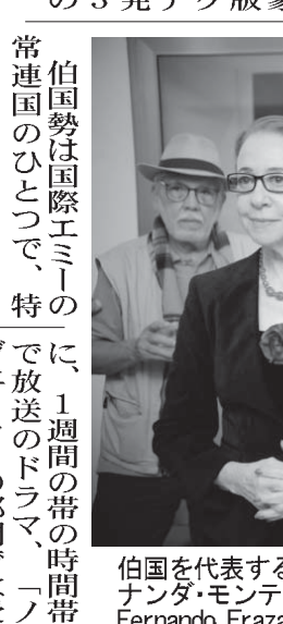
伯国を代表する女優フェルナンダ・フラスコ

5日、テレビ業界において権威ある賞、「国際エミー賞」の国際版、「国際エミー賞」において、ヴェーラ・インボリーが出演する位置にあった。チームは連敗を重ね、遂には10位圏外にまで落ちてしまった。同選手は代理人を務め