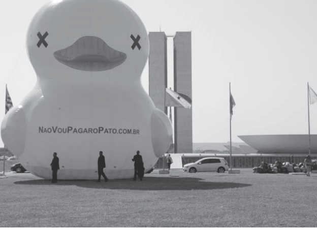
連邦議会議場前におかれた高さ12メートルのアヒルの人形

1日、聖州工業連盟(Fiesp)のパウロ・スカッピ会長らが首都ブラジリアの連邦議会議場前で、増税反対キャンペーンを開始した。同会長考案の「アヒルを払ってしまえ(他人のツケを払う)」の意」と題されたこのキャンペーンは、政府の増税に反対するものだ。