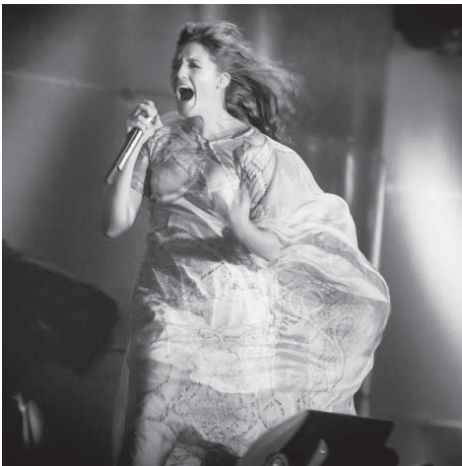
来年のフェスでトリをつとめるフロレンス&ザ・マシーン

6日、聖市で毎年恒例のロック・フェスティバル「ロラパルジーザ」の出演ラインナップが発表され、エミネムとフロリアン・ムンツが、12年連続で出演する。また、今年も注目の来年のメインは、過去に出演したことがない、新鮮で刺激的な音楽表現を出しているアーティストを重視している。このフェスティバルは、今年も注目の来年のメインは、過去に出演したことがない、新鮮で刺激的な音楽表現を出している。このフェスティバルは、今年も注目の来年のメインは、過去に出演したことがない、新鮮で刺激的な音楽表現を出している。