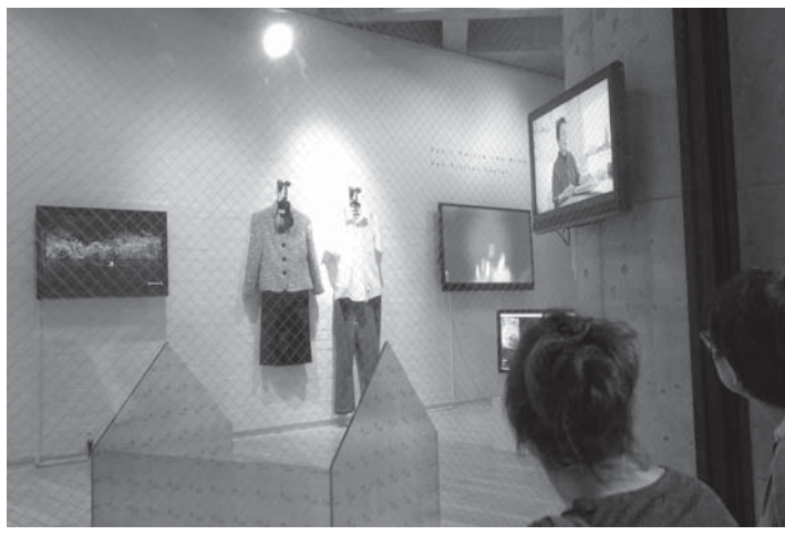
サテライト展「ノン・ビジター・センター」の展示風景。ガラスの壁越しに作品を見る

【共同】今年3月11日、見ることが出来ない展示会が福島県で始まった。タイトルは「Don't Follow the Wind (ドント フォロウ ザ ウィンド)」。会場は、東京電力福島第1原発周辺で立ち入り制限されている福島県双葉郡にあるが詳しい場所は明かされず、封鎖が解かれて初めて鑑賞できるようにする。