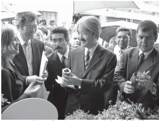
2006年11月3日、パラグアイ首都の中央市場を視察された秋篠宮殿下