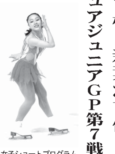
女子ショートプログラムで首位に立った樋口新葉

【共同】フィギュアスケートのジュニアグランプリ第7戦、クロアチア大会は8日、ザグレブで行われ、女子ショートプログラムで樋口新葉(S.P.)は樋口新葉が首位に立った。