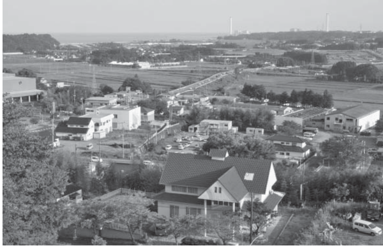
福島県楢葉町の街並み

【共同】東京電力福島第1原発事故で福島県楢葉町に出ている避難指示が解除され5日、1カ月たつ。サケが遡上する川があり、冬になると池に白鳥も飛来する自然豊かな町は今、荒れた住宅や農地が目立つ。帰還した町民はわずかで戻らないと決めた人も、生活環境に課題が多く、町は復興への歩みを始めたばかりだ。