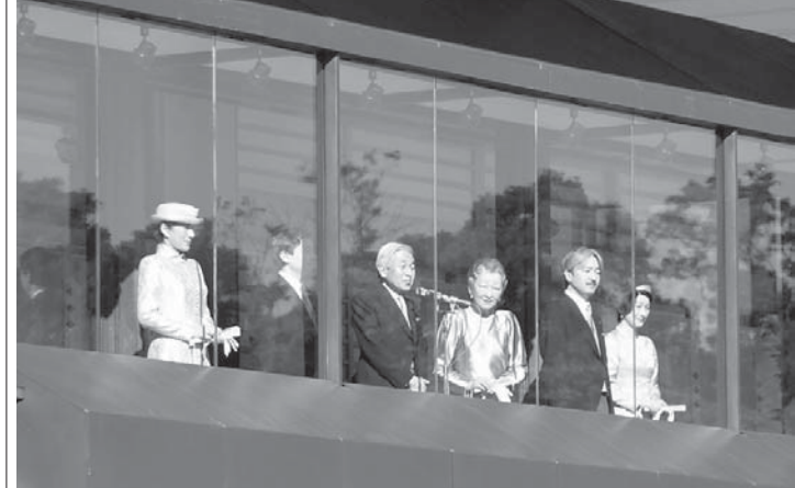
天皇誕生日の際、一般参賀に訪れた人々に対し皇族が皇居長和殿ベランダにて応える