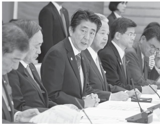
TPP総合対策本部の初会合であいさつする安倍首相。右隣は甘利TPP相=9日午前、首相官邸

【共同】政府は9日、環太平洋連携協定（TPP）発効に備え、全閣僚による総合対策本部を設置し、初会合を開いた。新市場の開拓、イノベーションの促進、国民不安の払拭という三つの基本方針を、農業の担い手育成など農林水産分野の基本方針を示した。