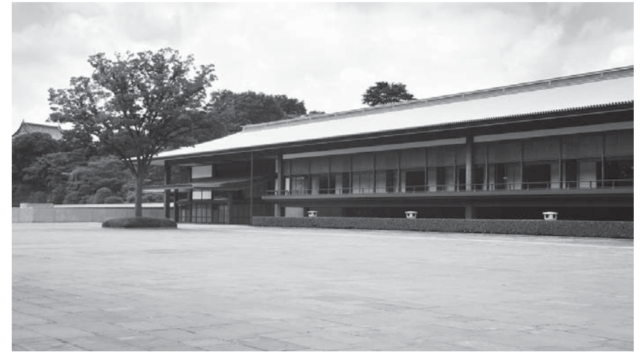
東庭から見た長和殿

明治21(1888)年に創建されたかつての宮殿は、昭和20(1945)年5月26日未明の大空襲によって、霞ヶ関一帯の火災から飛び火して炎上消失した。そのため、宮内庁庁舎の事務室の一部を仮の宮殿とする一方、両陛下は吹上御苑の中にある「お文庫」と呼ばれた地下各階の建物に仮住まいされた。