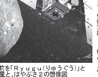
JAXAが名前を「Ryuguu(りゅうぐう)」と決定した小惑星と、はやぶさ2の想像図

決定は変わらなかった。ほかに市街地に適当な土地が見つかった。これは「Ryuguu(りゅうぐう)」に決定したと発表された。この移住地に関する資料類の記事は、暗に指摘している。ほば同時期、チバジリ河を挟んで西隣、チバジリが始めた植民地は、今日、人口50万の大都市に発展している。ロンドンに建設されたのは、植民地の始末の方で登場した英国資本の北パラナ土地会社であった。(後に内資化)