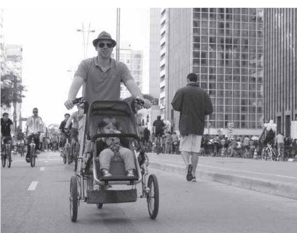
18日より毎週日曜の車両通行止が予定されているパウリスタ大通り

ド・クルス広場までの全長およそ2.6キロの区間で自動車、バイクの走行が禁止され、車道を歩いたり、自転車で行ったりする事ができる。ただし、地域住民、身体障がい者、パ大通りにあるクラブの会員、地域の職員の通勤に支障をきたす恐れがある。パ大通りは、右端の車線を交通のみに使用し、左側の車線を歩行者専用として使用する。最大時速10キロまでの制限付きで、通行が認められる。聖州検察局は歩行者天国案に反対で、聖市に決定的見直しを求める意向だ。07年に定めた対応改善誓約書(TAC)に