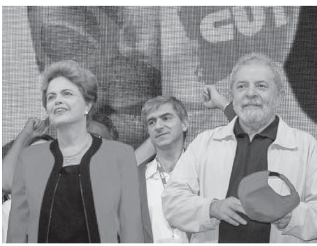
13日のイベントでのルウラ氏(右)(Roberto Stuckert Filho/PR)

問題の証言を行った(B)のロビイストで、16年の実刑判決を既に受けたブンライ氏は、6年の実刑判決を既に受けたロバート・フィリョ(PT)の義理の娘(嫁)の必要のためと称して交渉手数料を要求したとの説が浮上している。