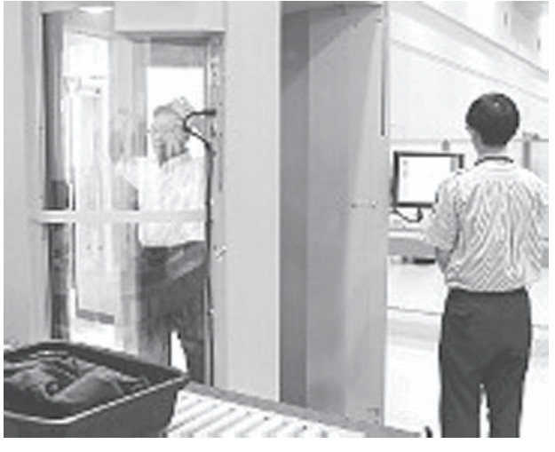
服の上から爆発物探知

【共同】北九州市の当地グルメ「小倉焼うどん」をPRしようと、市などは18日、小倉城(同市小倉北区)で焼うどんを並べ、市民ら約230人がうどんを盛り付けた3150皿を並べ、ギネス世界記録を更新した。市民らが挑んだのは