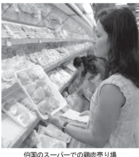
伯国のスーパーでの鶏肉売り場

全体として見ると、サンパウロ大都市圏の鶏肉卸売価格は、飼料を輸入に頼るためにドル高の影響を受けて20%も値上がりしている。生産価格の上昇と利益率の確保のため、生産者は、出荷価格を引き上げた格好だ。だがアナリストは、歴史的に見た鶏肉相場に近づいていると見ている。