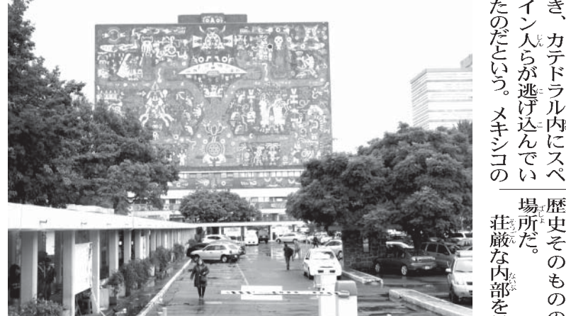
メキシコ国立自治大学、中央図書館の壁画。世界最大規模とあって圧倒される

小雨の降る中、一行はメキシコ国立自治大学(UNAAM)へ。1955(UNAAM)へ。1955年創立で、わずか4カ月前に創立されたペルーのサンマルコス大学に次ぐ南北アメリカで2番目に古い大学だ。三人のノーベル賞受賞者を輩出している。