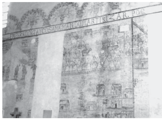
クエルナバカの大聖堂にある壁画。太閤秀吉による宗教受難を描いている

その殉教の様子を描いたものだが、メキシコ初の聖人となったヘススが、アカプルコから船に乗り込む前に意を固めたのがまさにこのカテドラルなのである。いつ描かれたのかは分らないが、1959年の改装時に幾重にも塗られた石壁の下から発見されたという。