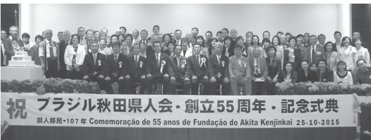
祝 ブラジル秋田県人会・創立55周年・記念式典 県人移民・107年 Comemoração de 55 anos de Fundação do Akita Kenjinkai 25-10-2015