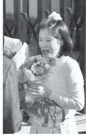
花を贈る母親。大阪府東区山崎で2015年10月26日、大阪府東区山崎で2015年10月26日、大阪府東区山崎で2015年10月26日...