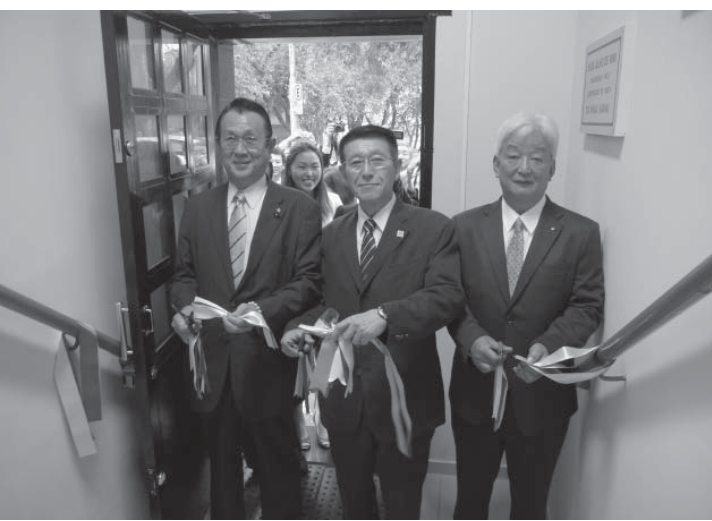
落成式でテープカットする佐竹知事(中央)ら