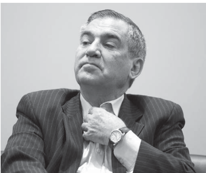
疑惑が浮上したジルベルト・カルヴァーリヨ元大統領府総務長官

26日のゼロテス作戦が、連邦政府に延長を認める暫定令(MP)を出し、連邦政府の税優遇処置延長を望む自動車産業界に、それを議会で通過