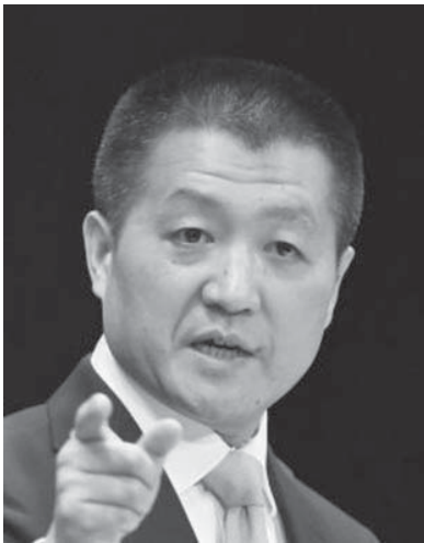
27日、北京の中国外務省で記者会見する陸慷報道局長