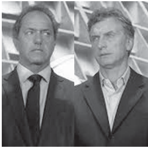
アルゼンチンの新大統領候補のダニエル・シオリ氏(左)とマウリシオ・マクリ氏

アルゼンチンでは、新大統領の就任により、経済活動が正常化すること多くの業界が期待している。ただし、同国の輸入業者にとっては、この問題はむしろ、新政権が取り組むべき緊急の課題と受け止められている。