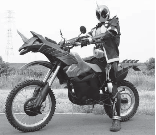
仮面ライダーゴースト(=2015 石森プロ・テレビ朝日・ADK・東映)

◎「突然にバスが止まらぬ 突然にバスが止まらぬ 突然にバスが止まらぬ 突然にバスが止まらぬ