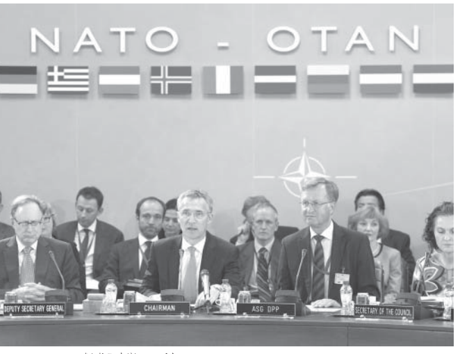
ロシアと対立姿勢を深めそうなNATO

「IS」は「公開処刑」の映像動画を配信するなど、その「残酷性」で嫌悪されています。そして、「パリ同時多発テロ」によって、まさに「全世界の敵」になりました。