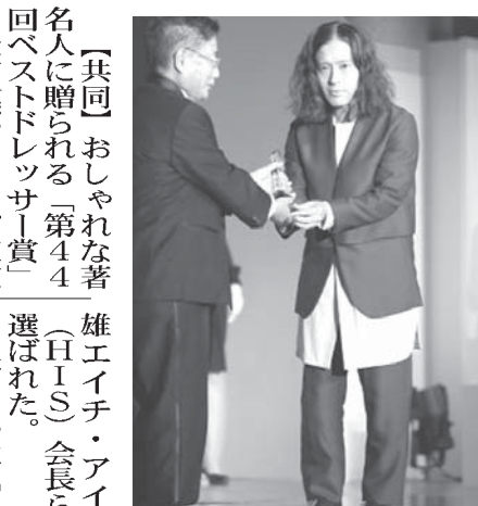
賞を受ける又吉さん(右)

「共同」おしやれな著名人に贈られる「第44回ベストドレッサー賞」の授賞式が25日、東京都内で開かれ、芥川賞を受賞したお笑い芸人の又吉直樹さんや鈴木直道・北海道夕張市長 沢田秀