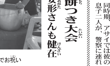
一定先に餅つきでお祝い

シニア世代の野球愛好者が15日昼、年末恒例の餅つき大会を行った。選手以外にも家族、友人ら50人以上