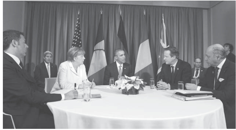
トルコで行われたG20会議で話し合う、キャメロン英首相、メルケル独首相、オバマ米大統領、レンツイ伊首相ら(16日、Foto: Georgina Coupe/ Number 10)