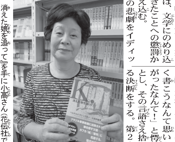
『K』消えた娘を追ってを手に小高さん(花伝社)

「二度と許されない過ち」 Z・クシンスキー(当時USP助教)だ。伯国に移住した高名なユダヤ系ポーランド人作家であるKは、ユダヤ文学の中でも特別な「ドイツ文学」に熱心するあまり、娘が非合法的な反政府闘争に巻き込まれていることに気付かな