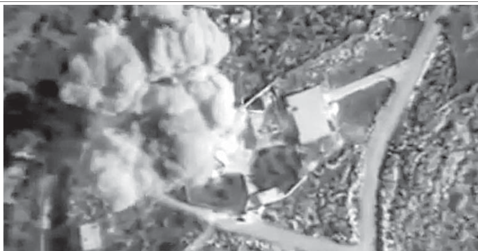
ロシアによるISIS空爆の様子(23日)

トルコ政府は「露軍機が自国の領空を侵犯したので撃墜した。露軍機が国境から15キロ以内で近づいたため、何れも警告したが無視された。撃墜した」と言っている。