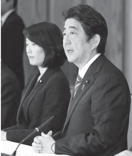
地球温暖化対策推進本部の会合であいさつする安倍首相。左は丸川環環境相。26日午前、首相官邸。