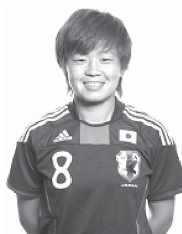
FIFAの世界年間最優秀選手の最終候補に入ったMF宮間あや

（ベルリン共同）国際サッカー連盟（FIFA）は11月30日、2015年の世界年間最優秀選手を表彰し、女子ではワールドカップ（W杯）カナダ大会で準優勝した日本代表のMF宮間あやを最優秀選手に選出した。