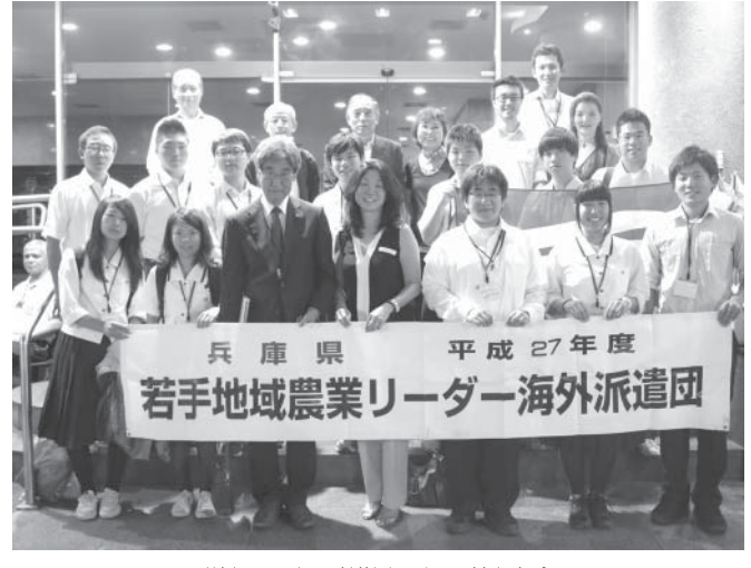
学生12人と県人会員で記念撮影

次世代の農業リーダー育成を目指す、兵庫県が実施する「若手地域農業リーダー育成研修制度」で、県内の農業高校・大学に通う学生12人が11月7日から17日まで来伯していた。 聖州マリリア、ポンベリア、パラナ州アカラナ、マリンガを訪問。各地農場の視察やホームステイ、日系団体との交流を行った。 県立農業大学の西山