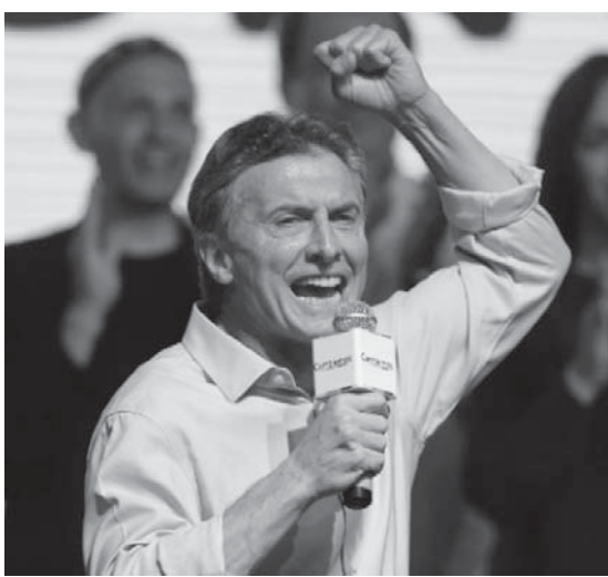
アルゼンチンのマクリ次期大統領

アルゼンチンでは小麦やその他の農業コモディティの生産が、長年の介入政策によって打撃を受けてきたが、より自由主義的な政権が誕生することで成長軌道に復帰すると期待されている。