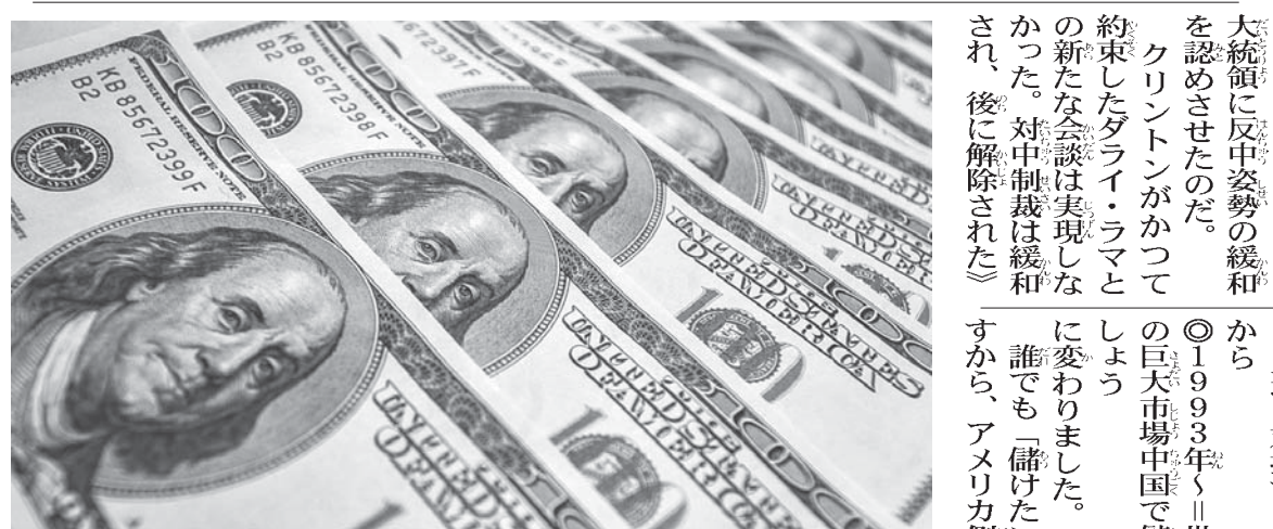
ゴールドマンサックスは「BRICs(ブリックス)ファンド」を閉鎖して見放した(Foto: Roberto Stuckert Filho/PR, 14/11/2014)