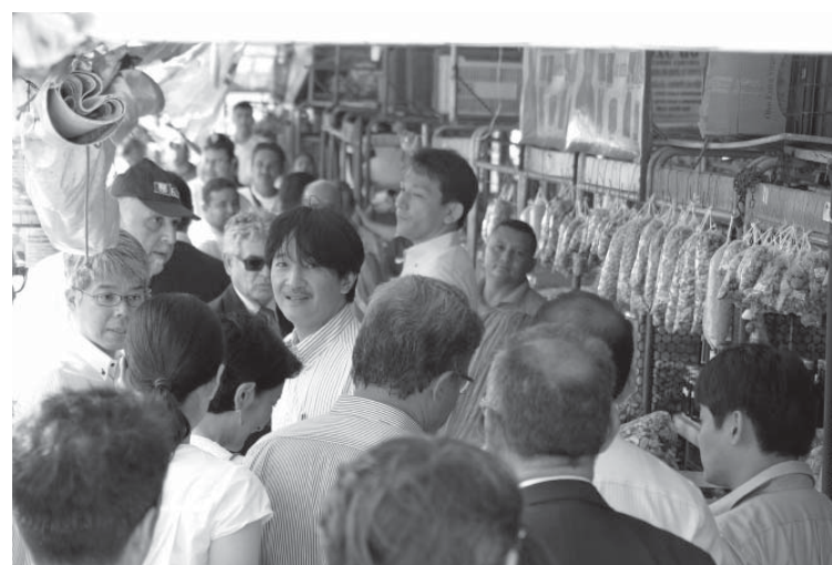
ベレンのヴェル・オ・ペーソ市場をめぐりながらの殿下

1895年に日伯修好通商航海条約を結び、両国にとって初めて対等条約が結ばれた。正式な外交が始まった。この日を記念して、各地でさまざまな行事が行われた。聖市では、文協が今回のために特別に用意した「皇室ブラジルご訪問回顧写真展」を一堂に集めて、移民史料館もじっくりと見学された。ハイライトは、修好通商条約締結日11月5日に首都の連邦議会で臨まれた記念式典。エドワルド・クーニャ下院議長