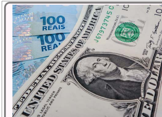
ついに1ドル=4レアル時代?!

「利回り20%」の ブラジル国債の意味 ブラジル国債(CDS)の利回りが20%に暴落した。これは、ブラジルの経済成長率(2015年)の約1.5倍に達している。この利回り上昇は、ブラジルの信用リスクが高まっていることを示している。ブラジルの中央銀行は、この利回り上昇を抑制するために、市場に介入し、国債の価格を下げ、利回りを下げようとしている。しかし、市場は中央銀行の介入を信用していない。この利回り上昇は、ブラジルの経済成長率(2015年)の約1.5倍に達している。この利回り上昇は、ブラジルの信用リスクが高まっていることを示している。ブラジルの中央銀行は、この利回り上昇を抑制するために、市場に介入し、国債の価格を下げ、利回りを下げようとしている。しかし、市場は中央銀行の介入を信用していない。