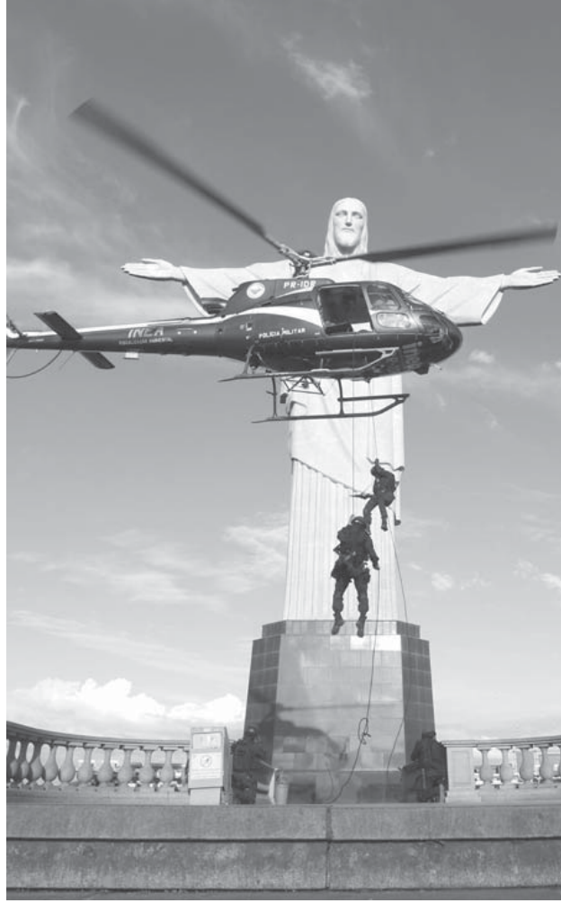
五輪の治安対策のために訓練を重ねる軍警特殊部隊 (2015年8月13日、Foto: Rogério Santana/ GERJ)

【リオ・デ・ジャネイロ共同】渡辺雅弘 リオで8月、五輪が開催される。南米初の五輪に向け、施設整備などはほぼ順調だとされるが、国を挙げての祝祭ムードにはほど遠い。ルセフ大統領は弾劾の危機に立ち、経済は過去20年で最悪。治安も悪化傾向で、テロの恐怖も影を落とす。いくつもの不安を抱えながら、ブラジルは五輪イヤーの幕を開けた。