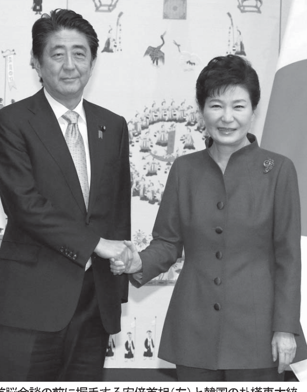
日韓首脳会談の前に握手する安倍首相(左)と韓国の朴槿惠大統領=2015年2月2日、ソウルの青瓦台

慰安婦問題で日韓の関係が悪化する直前の2011-12年にも、北核6カ国協議の再開、日韓安保協定の交渉、米海兵隊のグアム移転など、米国が東アジアから出ていく方向の流れが起きていた。 だが12-13年にかけて、慰安婦と竹島問題での日韓関係の悪化、日韓安保協定の棚上げ、尖閣諸島国有化を皮切りにした日中対立の激化、北朝鮮の消極性による6カ国協議の頓挫、北の中国の属国化拒否としての13年末の張成沢の処刑、米軍グアム撤退の雲霧散消、辺野古基地建設をめぐる沖縄への異様な圧力などが起こり、米国の東アジア覇権が存続するかたちで今に至っている。 今回、おそろしく米国からの圧力による慰安婦問題の解決、日韓安保協定の交渉が始まったことは、再び11-12年の「米国が出ていく流れ」の再開になるかもしれない。東シナ海紛争、南シナ海紛争への日本の介入、潜水艦受注に始まる日豪同盟の可能性(対米従属から日豪同盟への転換)などを含め、今年の展開が注目される。