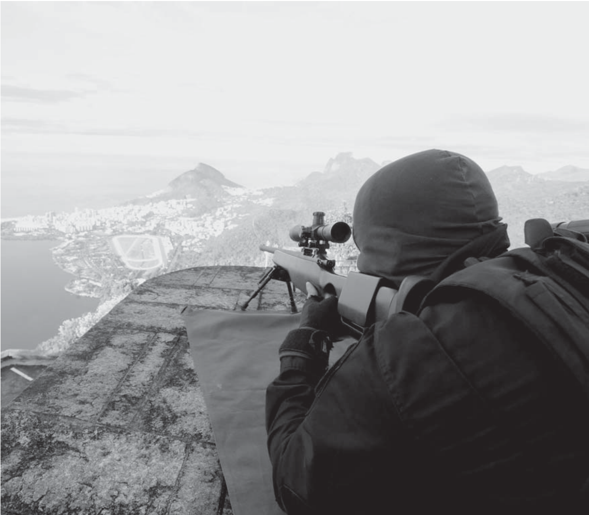
五輪開催まで1年を切った8月13日、コロコバードの岡で射撃訓練する軍警特殊部隊

先鋭化。政権が年金や貧困対策費などを国営銀行に肩代わりさせたところ、銀行に肩代わりさせられた協力を得たシリア人弾劾手続が先月始まった。国会は連立与野党が多数を占めており、現時点では弾劾成立の可能性は低い。政治は当面、安定しそくなると見られる。 「ある有力なファミリーが夜遅くまで大騒ぎしていた。警官が、うるさいと注意に行くと、殺してしまった」 「イズラエル・マルチンスというピストレロが、1970年代まではかなり古い建物が多い。中心部の街に入った瞬間、かなり古い建物が多い。中二階と並ぶ長い歴史を持つ町である」と知った。