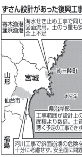
宮城県仙台市周辺の復興事業の現場。地図には、宮城県仙台市、南三陸町、宮城、山形、仙台、福島の地域が示されている。

【共同】東日本大震災の復興事業で、異なる工事に同じ凶面の流行や安全面での欠陥など、不適切な設計が横行していることが先月31日、分かった。国土も見抜けない設計が横行している。国土も見抜けない設計が横行している。国土も見抜けない設計が横行している。