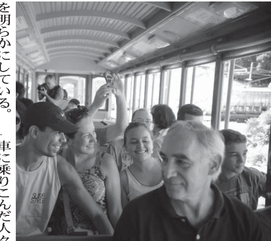
電車での旅を楽しむ乗客達

リオ市の名物に数えら れていたサンタレリザ の路面電車が、徐々に運 行を回復している。同 電車は11年8月に 死者6人と50人を超え る負傷者を出す脱線事 故が起きて、運行が停 止した。その後、復旧 が続き、運行が再開 している。15年7月に 再開されたのは、市中 央部