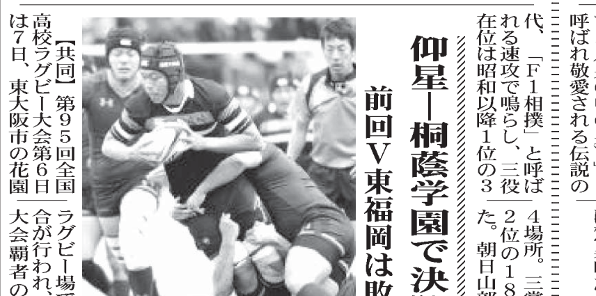
【共同】第95回全国高校ラグビー大会第6日。大会王者の東海大仰星がラグビー場で準決勝2試合が行われ、昨春の選抜大会で4-1で下した。決勝は11日に午後2時キックオフ。