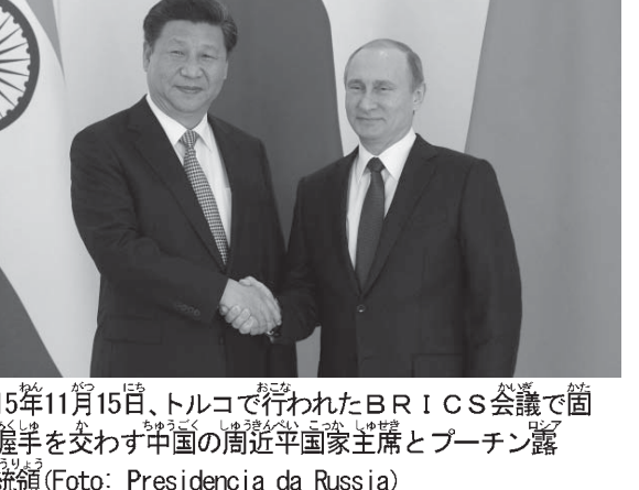
2015年11月15日、トルコで行われたBRICS会議で中国の習近平国家主席とロシアの大統領

「親中派」がクリントンに説得した論拠は、「中国は、人口13億人、世界最大の市場です。中国とのビジネスは、