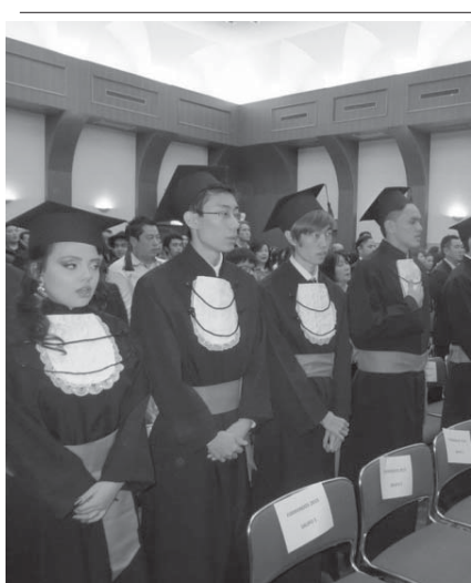
卒業式の様子

「鐘をついた人々は、鐘を叩くことが、自分自身に語りかけ、新年を迎える」と語り、笑顔を見せた。一人目は鐘をついた「ゴーン」という柔らかい音で、鐘の音は、新年を迎える。