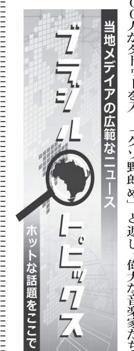
ホットな話題をピックアップ

を明らかにしている。 運行区間がラゴ・ド ス・ギマランエスまで伸 びた事を記念する開通電 証。この電車はサンタ