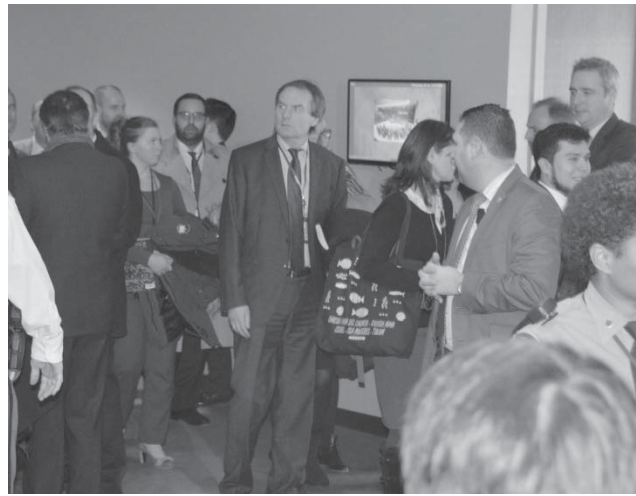
6日、安保理の緊急会合を終え、会場を後にする外交官ら（ニューヨークの国連本部）

【ニューヨーク、ワシントン共同】国連安全保障理事会は6日（日本時間7日）、北朝鮮による水爆実験の実施発表を受け非公開の緊急会合を開き、過去の核実験で採択した安保理決議の明白な違反で「国際平和への脅威」として強く非難する報道声明を出した。