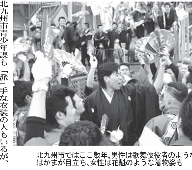
北九州市ではここ数年、男性は歌舞伎役者のような光沢の、女性には花魁のような着物姿も

【共同】自閉症やアスペルガー症候群などの発達障害者に対する「発達障害者支援法」が約10年ぶりに改正される見通しとなった。他人とコミュニケーションを取るのが苦しかったり、日常生活での困難さに対する理解が十分と見えない。