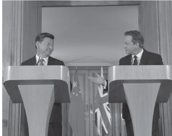
習近平訪米に近づく中国。英国を訪問した習近平中国国家主席(2015年10月21日。Foto: Georgina Coupe/The Prime Minister's Office)

2016年、世界はどうなるのでしょうか? 今日、アメリカと覇権を争う中国の動きを考察します。