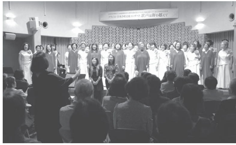
当日はブラジルが赤、日本が白の衣装で、偶然にも国旗を表すような形に

ボ語曲「Sambale」や「花は咲く」を合同演奏し、最後は集まった150人の観客も一緒に歌って感動の幕切れとなった。