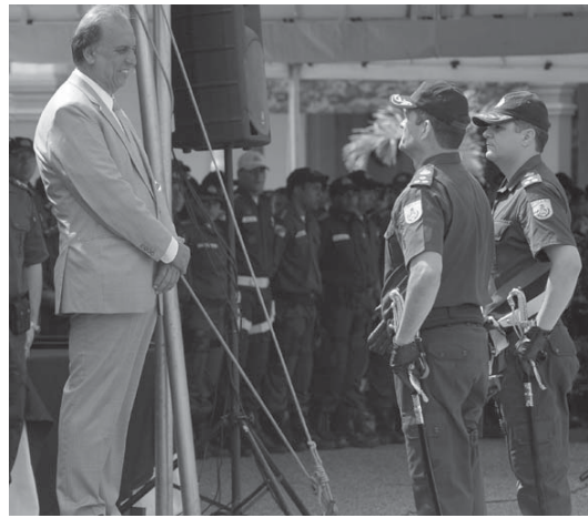
1月4日にリオ州軍警総司令官に就任したエジソン・ドウアルテ・ドス・サントス・ジュニオール大佐(中央)

1月5日、グローボ局の番組やウェブサイトで公開された、リオの中心地で盗賊が白昼堂々と盗みを行う映像はインターネット上で大きな反響を呼んだ。6日は朝から、市中央部、特に映像の舞台となったラゴ・デ・デ・カリアオの警備は強化され、強盗に奪われた腕の傷(22)が「いつも同じ