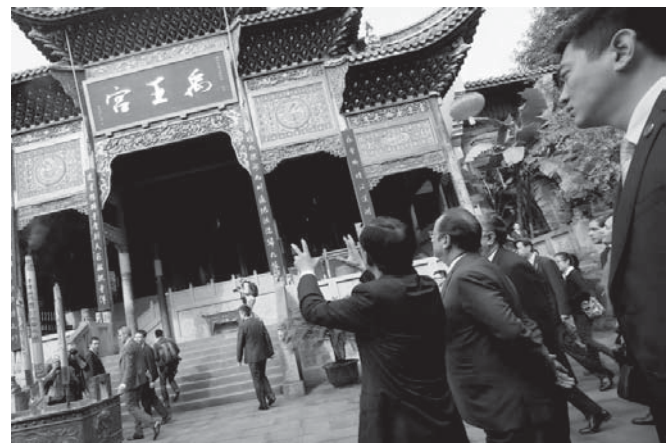
仏大統領オランドを訪問した中国の習近平(2015年11月2日。Foto: Laurent BLEVINEC/Elysee - Presidence de la Republique francaise)

「親中派」がクリントンに説得した論拠は、「中国は、人口13億人、世界最大の市場です。中国とのビジネスは、