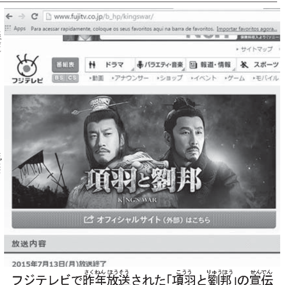
2015年7月13日(月)放送された「項羽と劉邦」の宣伝

「親中派」がクリントンに説得した論拠は、「中国は、人口13億人、世界最大の市場です。中国とのビジネスは、