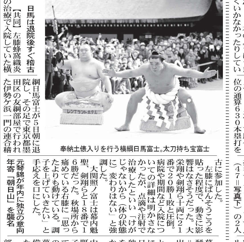
日馬は退院後すぐ稽古。左膝蜂窩織炎の治療で入院していた横綱日馬富士が5日朝に退院し、その足で東京都墨田区の友綱部屋で行われた伊勢ヶ浜一門の連合稽古