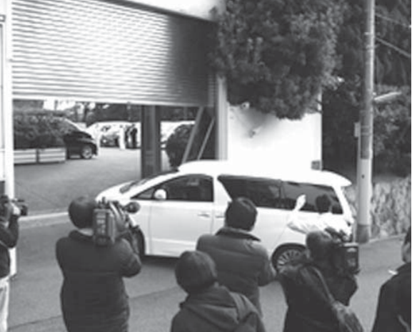
新年の方針を示す「事始め式」に出席するため、直系組長らが集まった山口組総本部

【共同】創立100周年に当たる指定暴力団山口組(総本部・神戸市灘区)と神戸山口組との抗争は、現段階で新組織の8月下旬当時をこう振り返る。その後、警察当局と二つの山口組との攻防が激化。警察庁によると、9月から11月、下町まで双方の事務所