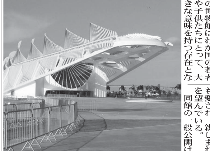
「明日のミュージアム」の外観

12月17日、ポ ル・マラヴィーリヤの 名前でも知られるリオ 北部の港湾地区のマウ アー広場で、新世代博 物館、その名も「明日 のミュージアム」(ムセ ユ・ド・アマニヤム)が 開館した。この博 物館は環境問題 をテーマにしており、館 内は「宇宙」「地球」 「近代」「人間が産業