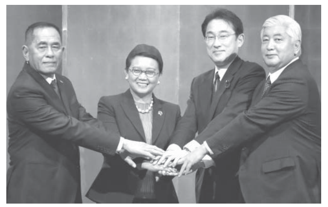
南シナ海めぐり中国けん制、握手する外相と防衛相...