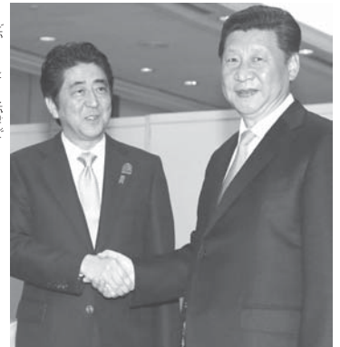
2015年4月22日、日中首脳会談...