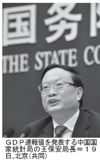
中国国務院報道官王勇が19日、北京で記者会見し、15年10月のGDP速報を発表した。

【北京共同】中国国家統計局は19日、2015年の国内総生産（GDP）速報値が物価変動の影響を除いた実質で前年比6.9%増と発表した。