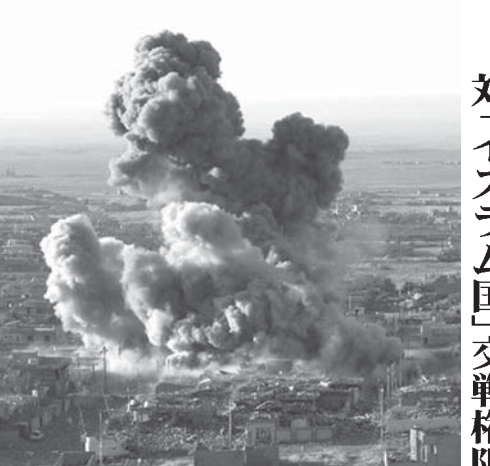
再開された米軍のアフガン空爆

韓国科学技術院が披露した二足歩行の災害救助ロボットがカメラやセンサーを使って障害物を取り除き、人を引いた。トヨタ自動車は昨年11月、向こう5年間で人工知能分野に約10億ドル(約1200億円)を投資する計画を発表した。