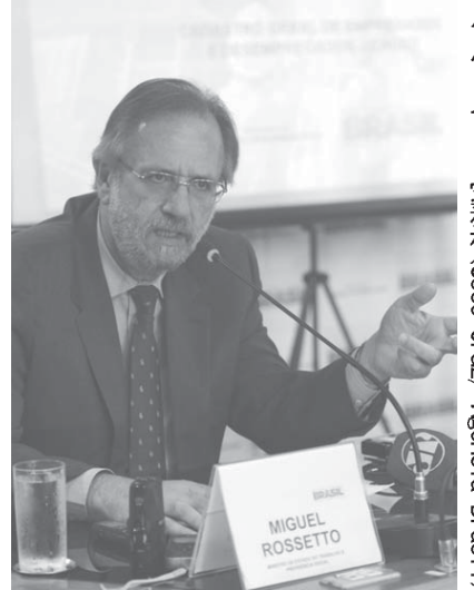
ミゲル・ロセット労働相

マイナスになった。雇用総数減少は1999年以来16年ぶりのことだ。内訳を見ると、8部門中7部門で雇用が減少。中でも製造業は60万8900人を失い、同年の9000人を失った。建設業の結果となった。建設業も41万7千人減少した。 また、サービス業でも7万6100人、商業も21万8700人など、第3次産業での雇用喪失も起きた。鉱業は1万人4千人、行政機関は9200人、公共サービス、公社関連も8400人の減少を記録した。そんな中、唯一の例外は農牧畜業で、98000人の雇用が増えた。農