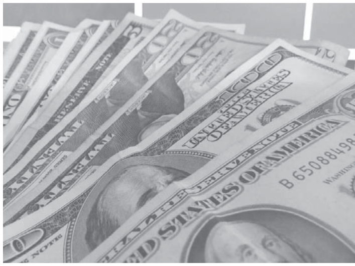
2016年も厳しい見通しの伯国経済

経済基本金利 (Seiic) が市場関係者の予想に反して14.25%のまま据え置かれたことで、今年もインフレが継続するとの見方が広がっている。対ドル、レアル安傾向も変わらず、21日はレアル・ブロン採用以来最安値を記録したが、ネルソン・バルボア財務相は今年第4四半期の経済の回復に自信を見せると22日付伯字各紙が報じた。