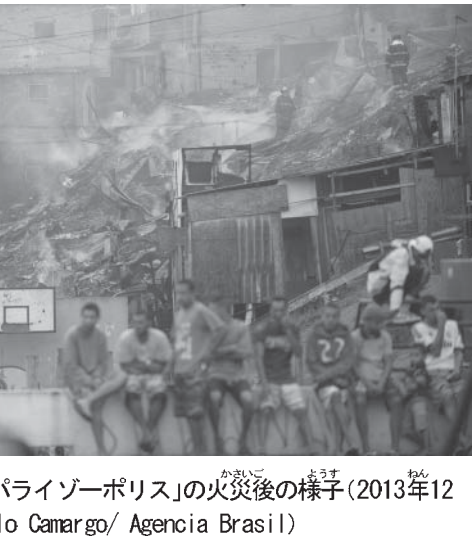
聖市のファベラ「バライゾーポリス」の火災後の様子 (2013年12月10日, Foto: Marcelo Camargo/ Agencia Brasil)