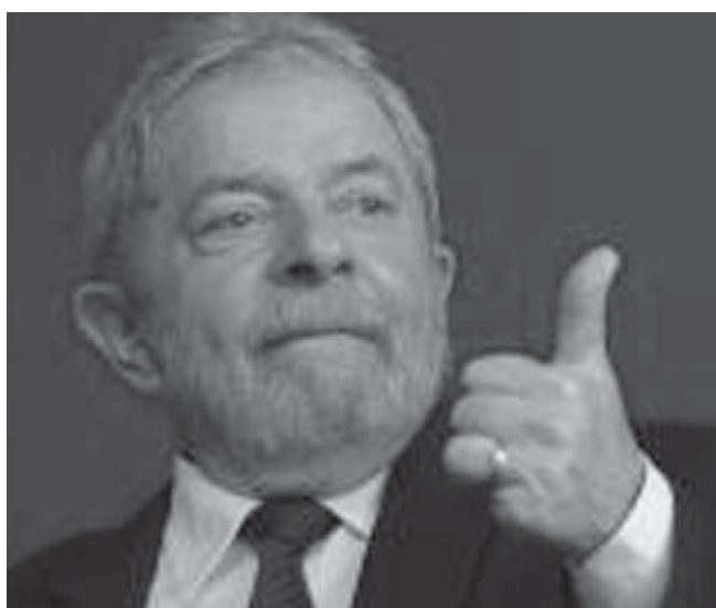
ルーラ前大統領

マルコンデス容疑者が、イス・クラウジオ氏の企業「グ・エスホルチ・ウオ」に支払った250万レアルは、2009年、10、13年に提案された暫定令(MP)471号、512号、627号に関するものと見られている。