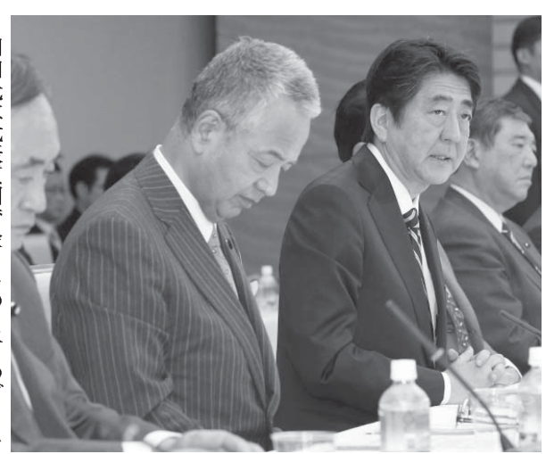
産業競争力会議で、あいさつする安倍首相。左から2人目は甘利経済再生相=25日午後、首相官邸

首相「説明責任果たして」 衆院代表質問スタート 【共同】安倍首相の施政方針演説など政府4演説に対する各党代表質問が26日午後、衆院本会議で始まった。