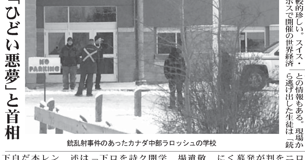
銃乱射事件のあったカナダ中部ラッシュの学校