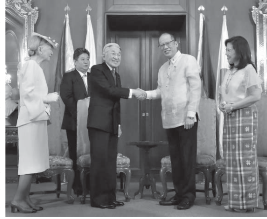
両国首脳、フィリピンのマニラで会談。安倍首相（左）とアキノ大統領（右）が握手を交わす。27日、マニラのマラカニアン宮殿で撮影。共同

「マニラ共同」国交正常化60年に際し、国賓としてフィリピンを公式訪問中の天皇、皇后両陛下は27日夜、首都マニラのマラカニアン宮殿でアキノ大統領主催の晩餐会に出席された。