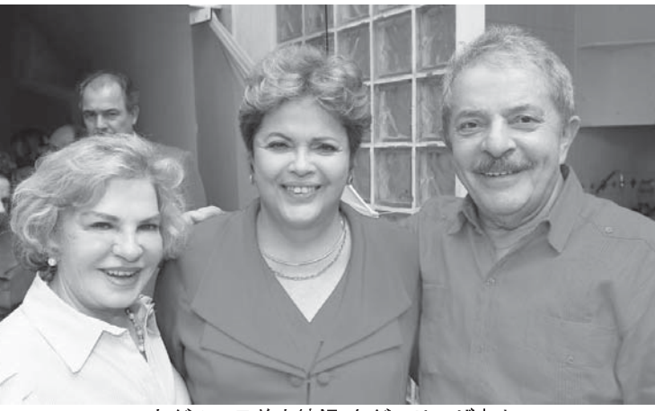
右がルーラ前大統領、左がマリーザ夫人