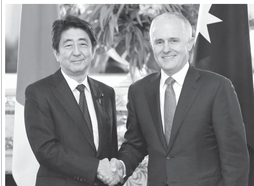
安倍新協定締結へ加速。首脳会談を前に握手を交わす安倍首相(左)とオーストラリアのターンブル首相=15年12月18日午後、東京・元赤坂の迎賓館

日本はこれまで、対米従属以外の戦略を全く持たない国だった。私が知る限り、日本政府が対米従属以外（対米自立）の戦略をわざわざもつたのは、1970年代に米国の覇権構造の多極化をめざした時に米国に勧められ、日本政府が作った防衛の対米自立第一中曽根ドクトリンと、2009年11月の鳩山政権が米中等距離外交をめざし、結局は官僚機構につぶされた時の自衛隊の対米従属の現況だ。その後、民主党政権は、官僚機構（外務省と財務省）の傀儡で、対米従属の本格に戻った。 だが、昨年の後半から、安倍政権は、従来の対米従属の国から微妙に外れる新しい戦略を、目立ち始めようとしている。それは、(1)日豪での潜水艦技術の共有化、(2)従軍慰安婦問題の解決によって交渉が再開された日韓防衛協定と北朝鮮核6カ国協議、(3)安部首相が新年の会見や先日のFT(日経)のインタビューで明らかにした日露関係改善の試み、(4)中国の脅威を口実とした東シナ海から南シナ海に向けた自衛隊の訓練活動(日本の軍事影響圏)の拡大、などである。 中国を取るか、日本 (1)については、昨年11月に配信した記事「日豪は太平洋の第3極になるか」で詳しく書いた。この記事は、有料記事(田中宇プラス)として配信したが、日本国民の全体にとって非常に重要な事項なので、例外的にこのたび無料記事としてウェブで公開した。まだ読んでいない方は、ぜひこの記事を読んでいただきたい。「日豪は太平洋の第3極になるか」(http://tanakaews.com/151129summary)