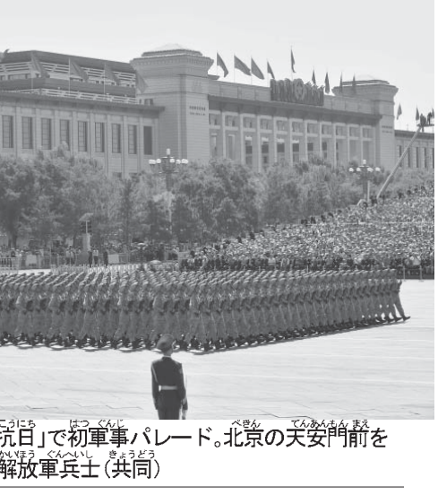
15年9月3日、「抗日」で初軍事パレード。北京の天安門前を進行する中国軍人民解放軍兵士