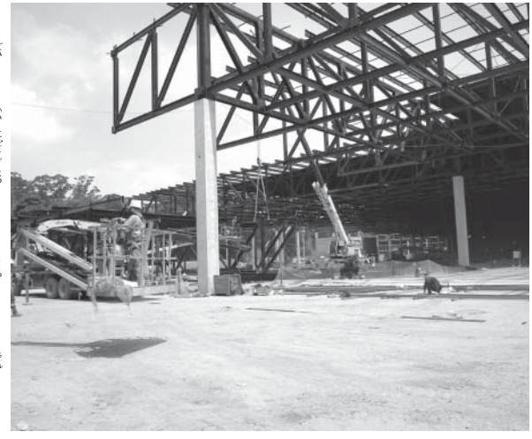
屋根の取り付け作業が進行中

既に10年以上使用を続け、すっかりおなじみになった同会場だが、例年駐車場が混雑し、会場まで遠いことに大きな不満が集まった。しかし、施設横に4500台収容可能な立体駐車場が既に完成、さらに直接会場に移動できる歩道橋も設置予定だ。雨で足元がぬかるんだ昨年のような心配も解消される様子。