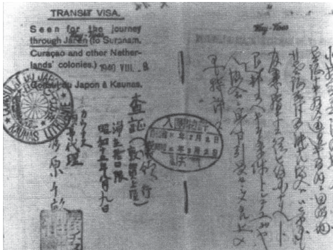
杉原領事代理による手書きのビザ