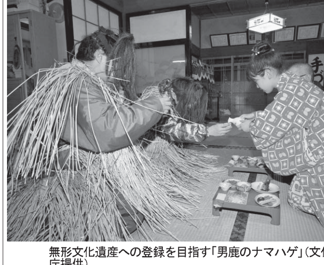
無形文化遺産への登録を目指す「男鹿のナマハゲ」