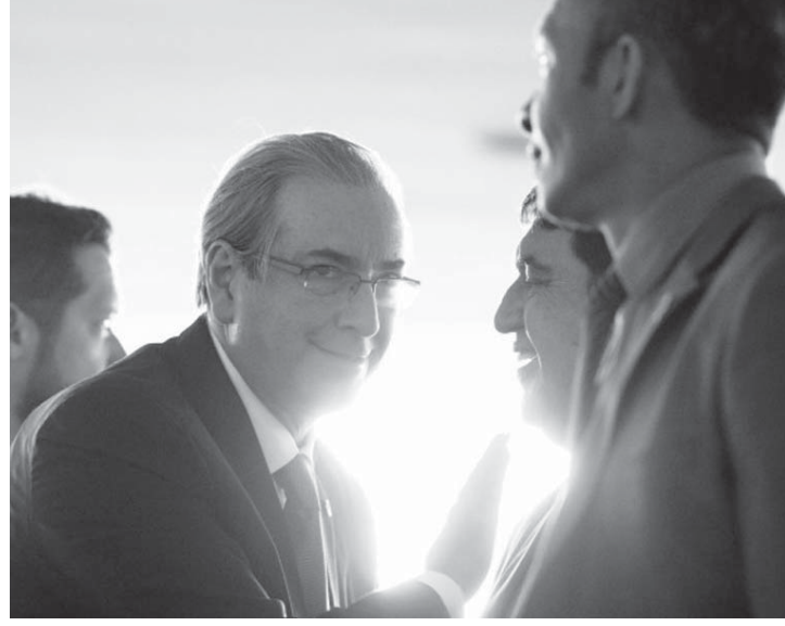
17日のクニヤ下院議長

クニヤ長官の見解は、同議長が昨年8月、約500万ドルの賄賂を「クニヤ議長がベトロフ」を受け取ったとして、収賄と資金洗浄の容疑で起訴された後、同議長の弁護士団が、起訴の基となったロビイストのジュリオ・カマルゴ被告の報復行為を無効と認め、同議長への起訴を取り下げさせようとしたことへの返答として表明された。