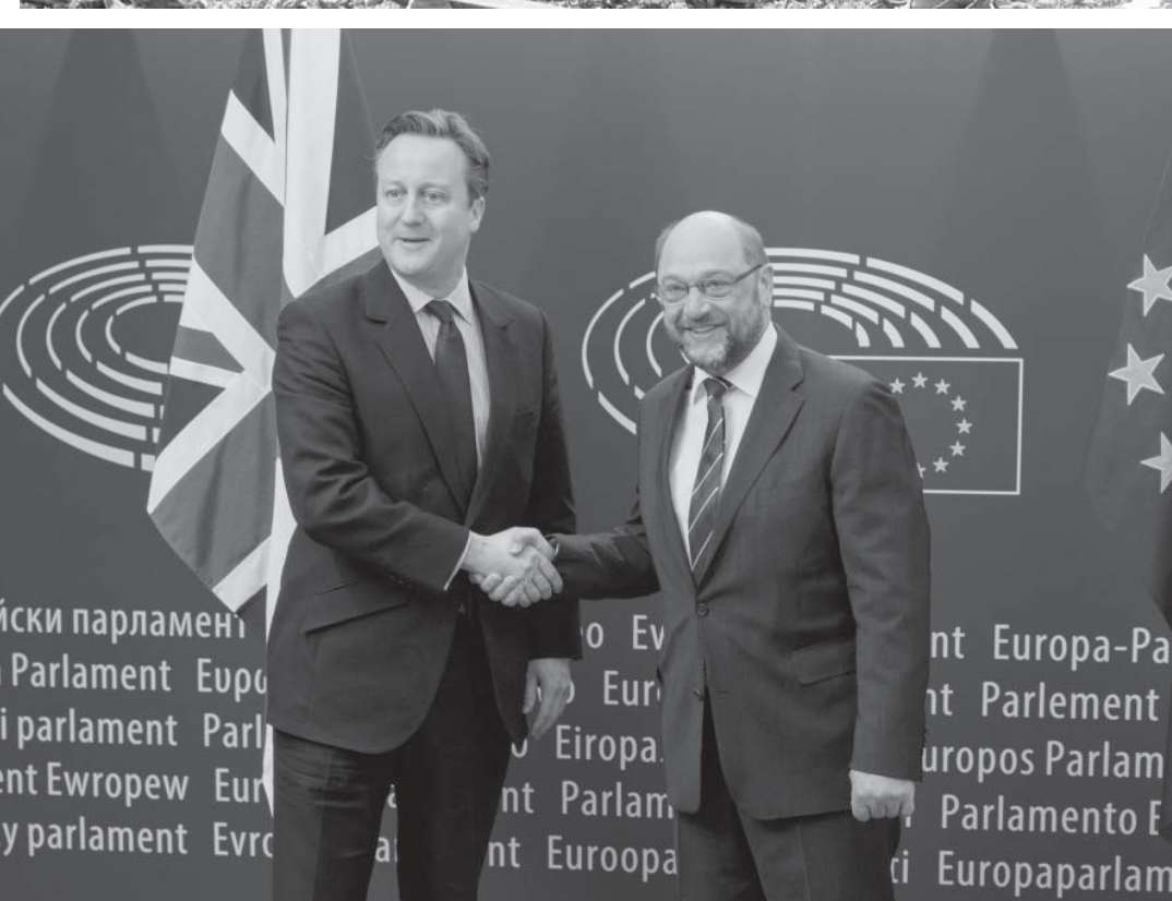
爆撃されたシリアの病院の様子(15/02/2016)

い恒久基地でなく、簡単にやめられる巡回型の移動駐留にしたいと言っている。米英は、ポーランドやリトアニアに加勢している。とはいえ、ウクライナの内戦自体は膠着状態で、次に何か大きなことが起こるとしたら、それは財政破綻を皮切りにウクライナ政府が崩壊し、内戦を続けられなくなるとロシア側に譲歩することだ。ウクライナ政府は、もう何カ月も財政破綻寸前だ。IMFなど債権者に目をうつらうつらして延命している。経済難がひどくなるとヤツニコ首相への批判が強まり、2月15日に議会で内閣不信任案が出されたが僅差で否決された。ヤツニコは何かと統制できたが、政治混乱はむしろ拍車がかかっている。ウクライナ内戦は、シリアと同様、米欧の不利、ロシアの有利が増しつつある。