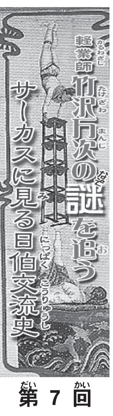
サカスに見る目録文流史

幕末、米大統領に歓待された芸人 「サ物語」の三好によれば、日本への西洋サカスの初上陸は、幕末の文久4(1864)年3月5日に横浜で興行をした米国人リズリー・サカス一団だといふ。黒船が大砲を振りかざしてむりやり開国させた後、ローバリーゼーションの先兵として訪日したのがサカス一団だった。このリズリーが横浜の