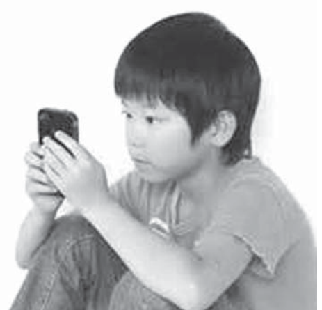
スマートフォンが手放せない「ネット依存症」の小学生

「共同」スマートフォンなどが手放せない「ネット依存症」の患者が低年齢化している。従来、10代後半から20歳前後が中心だったが、スマホが低年齢に普及したことから、最近では小学生が専門医を受診するケースがあるという。重度の依存は不登校や健康被害を招く恐れがある。専門家は子どもの様子をよく観察することにも、親のまねをするう