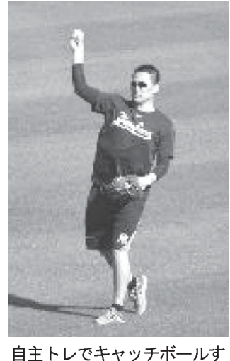
投手の大谷翔平、捕手の松本浩之、野手の田中浩二、投手の田中浩二

【共同】米大リーグの公式サイトは、18日からの開幕投手をめぐり、田中浩二選手を特集した。田中は、大リーグに参入して2年連続の開幕投手に選ばれた。2012年の開幕投手に選ばれた田中は、大リーグに参入して2年連続の開幕投手に選ばれた。2012年の開幕投手に選ばれた田中は、大リーグに参入して2年連続の開幕投手に選ばれた。