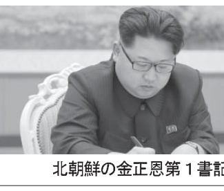
北朝鮮の金正恩第1書記

【北京共同】北朝鮮の対韓国窓口機関、祖国平和統一委員会は10日、韓国との自由貿易に反対し、南北間の経済協力や交流事業に反対する全ての合意の無効を宣言し、北朝鮮内にいる韓国の資産を完全に清算するとの報道官談話を発表した。朝鮮中央通信が伝えた。朝鮮が2月に稼働中断した南北経済協力事業の開城工業団地や、観光事業が2008年から中断している北朝鮮・金剛山にある韓国企業の資産などを事実上接収するとみられる。韓国は北朝鮮が極端に悪化した責任は「朴槿恵とその一味にある」と主張した。南北間で唯一残っていた経済協力事業の開城工業団地は、韓国政府が2月に北朝鮮の核実験と事実上の長距離弾道ミサイル発射に対する独自制裁と特別措置を連結して取り止めた。南北関係が極端に悪化した責任は「朴槿恵とその一味にある」と主張した。南北間で唯一残っていた経済協力事業の開城工業団地は、韓国政府が2月に北朝鮮の核実験と事実上の長距離弾道ミサイル発射に対する独自制裁と特別措置を連結して取り止めた。南北関係が極端に悪化した責任は「朴槿恵とその一味にある」と主張した。