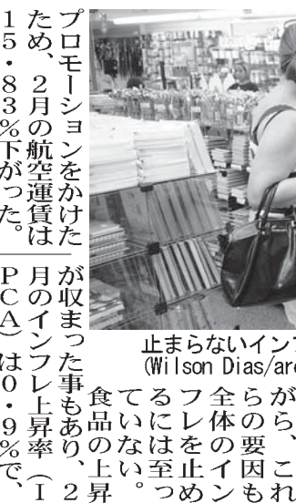
止まらないインフレに若干の歯止めも兆し

景気後退が長く、中銀の予想に反し、インフレ進行のペースは弱まる兆しが見えていない。しかしながら、一般消費者の購買力低下が、価格上昇のペースを下げ始めていると10日付フォーリア紙が報じた。