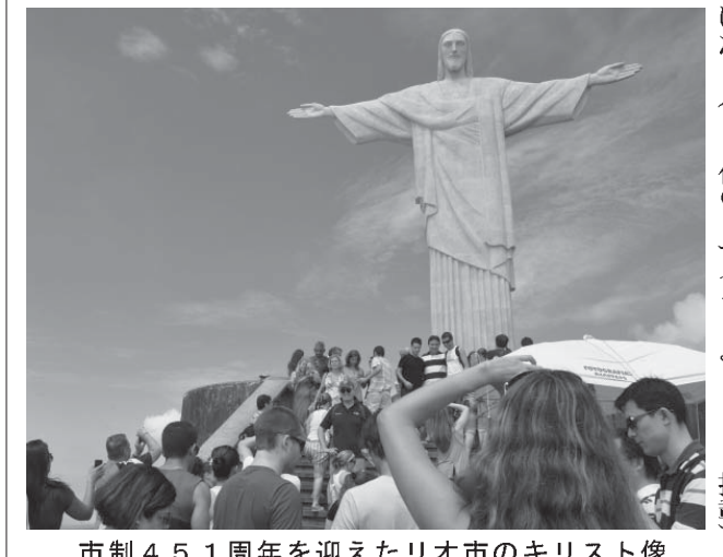
市制451周年を迎えたりオ市のキリスト像

3月1日は451回目のリオ市制記念日だ。同日は、451回目の誕生日を祝うため、全長20メートル、市の旗や五輪のマークなども描いた巨大なケーキをセントロにあるラルゴ・ダ・カリオカ広場に設置した。 ケーキは正午頃配布されたが、エドゥアルド・パエス市長は式典に欠席した。しかし、今年の市