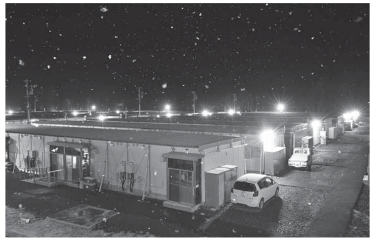
東日本大震災から5年、空室が目立つ仮設住宅。夕暮れから雪が降り始めた=10日夜、岩手県宮古市田老

犠牲者数は2万1865人となった。26兆円の復興予算を計上した5年間の集中復興期間は3月で終わる。安倍首相は10日の記者会見で、今後5年間を復興・創生期間として十分な財源を確保して自立を支援したい」と述べた。大地震は2011年3月11日午後2時46分に発生し、宮城県で最大震度7を観測。大津波が太平洋沿岸の広い範囲を襲い、多くの市街地や集落が壊滅的打撃を受けた。警察庁によると、死者は1万5894人、行方不明者は2561人、3県では、プレハブ仮設住宅で今も計5万7677人が暮らしている。原発事故では、福島県