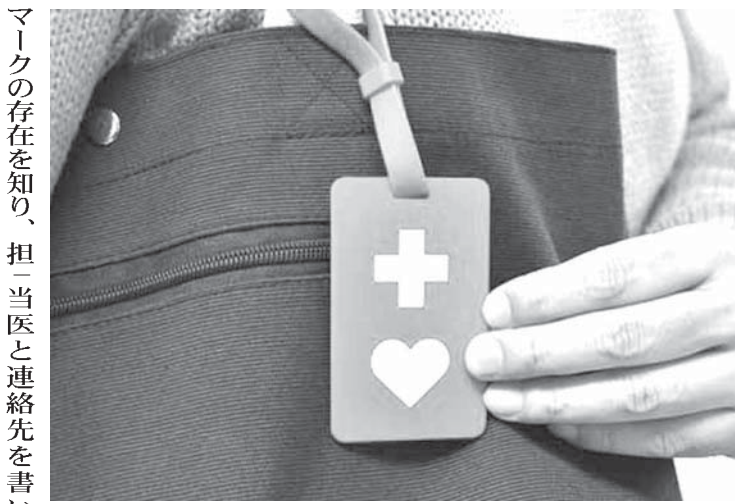
広がるヘルプマーク

ヘルプマークは、赤地に白いマーク(十)とハートのマークがデザインされている。ヘルプマークがデザインされているが、かばんなどに貼る。裏側にシールを貼る。緊急連絡先や自分の障害、助けてほしいことなどを書き込める。「最初は抵抗があった