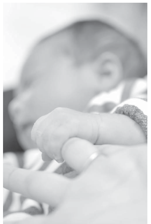
母親の指を握る赤ちゃん

今回の犯人は、ウズベキスタンの女性です。ロシアの民族主義者が激怒して、関係ないウズベキスタンの人々に復讐しはじめようというのです。日本の皆さんは、この証言を聞いて、「冗談だろう」と思ってしまうのでしょうか。しかし私は、「そうだよな〜」と思ったのです。ご存知の方も多いと思いますが、ロシアの民族主義は、数年前まで大変なものでした。スキンヘッド集団が外国人、特にアジア系、コーカサス系を無差別攻撃していた。(※中央アジアの旧ソ連国ウズベキスタンからは、ロシアに出稼ぎに来る人がとても多い。彼らのほとんどが、3K労働者をしてい