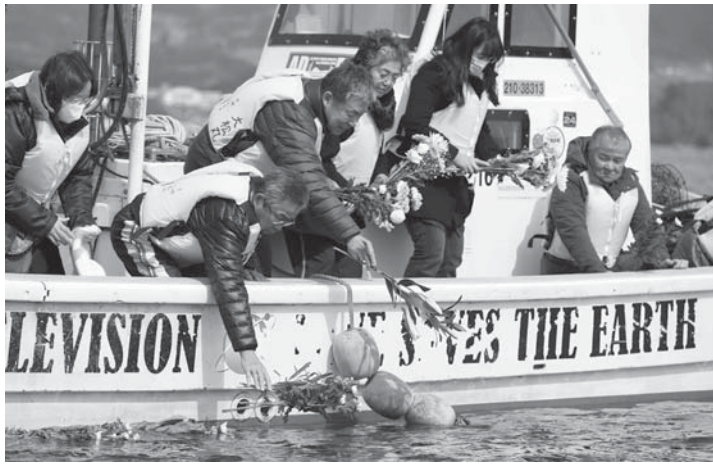
岩手県陸前高田市の広田湾で、海上保安部の潜水士による海中捜索を見守り、献花する行方不明者の家族ら=10日

【共同】東日本大震災は11日、発生から5年の日を迎えた。震災と東京電力福島第1原発事故による全国の避難者は、なお17万4千人に上る。午後には政府主催追悼式や全国各地の慰霊行事があり、千年に1度とも言われた大災害の犠牲者に、鎮魂の祈りがささげられる。