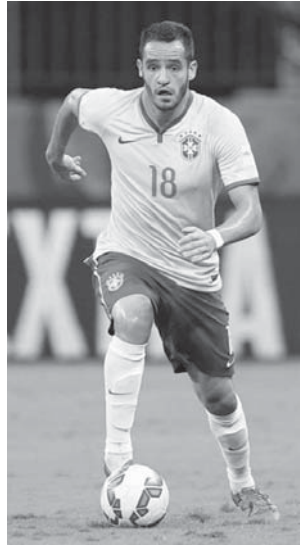
中国リーグに巨額移籍した昨年の全国選手権最優秀選手レナト・アウグスト (Renato Augusto)

2月26日、中国サッカー・リーグの冬の移籍市場が閉幕を迎えた。年明けから大量に有力選手を引き抜かれた伯国サッカー界にはひと安心といつたところだ。中国は世界のサッカー界にとって大きな台風の目となりつつある。歴史が浅く、レベルも決して高いとは言えないが、経済の急成長と共に、サッカー・リーグ「スーパー・リーグ」を盛り上げようと必死だ。