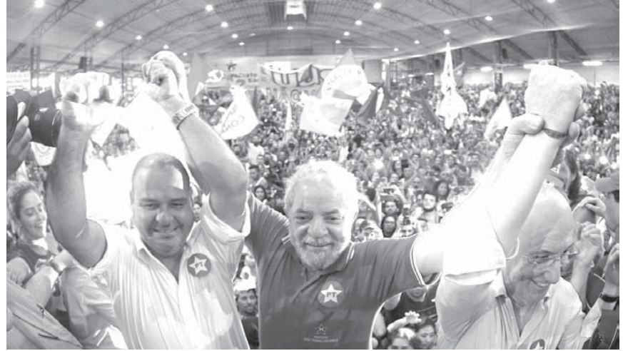
4日晩、強制聴取後にPT党本部で仲間と囲まれたルーマ、ルーラ (Foto: Ricardo Stuckert/ Instituto Lula, 04/03/2016)

先週、司法・警察の強制取調べを受け、ルーラさんは早速今週ブラジルに飛び、大統領、PT党幹部、与党PMDB幹部、上院議員との会合など精力的に動きまわった。その時に、この発言を残したそうです。