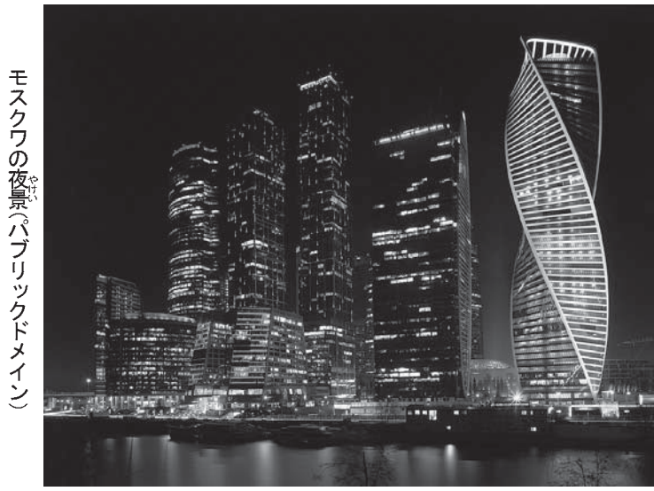
モスクワの夜景(パブリックドメイン)

「モスクワ女児斬首は『アラアの命』」AFP B News 3月3日 8時38分配信 「3月3日 AFP」ロシアの首都モスクワ(Moscow)で、ペビーシッターが預かっていた女の子を殺した。首と胴体を切り離し、頭部を掲げて路上を歩き回った事件で2日、裁判所に出席した容疑者が「アラアに命が奪われた」と述べた。