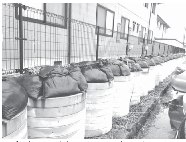
プロジェクトの事務所付近にあるアパートの軒下にまで置かれた汚染土

【共同】東京電力福島第1原発事故に伴う福島県内の除染廃棄物を、同県双葉、大熊両町に建設する中間貯蔵施設の予定地に試験輸送を始めて13日、1年がたった。予定地の用地取得は遅れ、施設全体が運用できる時期は見通せない。土地や建物の補償額の算定を短縮できるかが鍵となる。