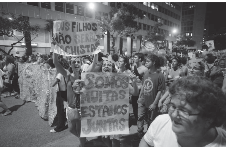
世界女性の日だった3月8日に、リオで中絶合法化を求め抗議する人々

デモ参加者達は中絶の自由を妨げる法令を批判して、シユプレヒョールをあげ、「ブラジルの中絶を禁止しているが、違法な中絶行為は年間100万件以上起こり、毎日1人の女性がそのために命を落としている」と中絶禁止は、黒人女性や貧困女性を正当化するものだ」といったスピーチも繰り返された。リオ州では家庭内暴力や女性への脅迫が数多く報告されており、デモ参加者は、暴力に苦しむ女性被害者たちの政治的支援も求めた。