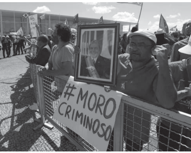
ルーラ氏就任前に大統領府前に集まった人たち(17日、)