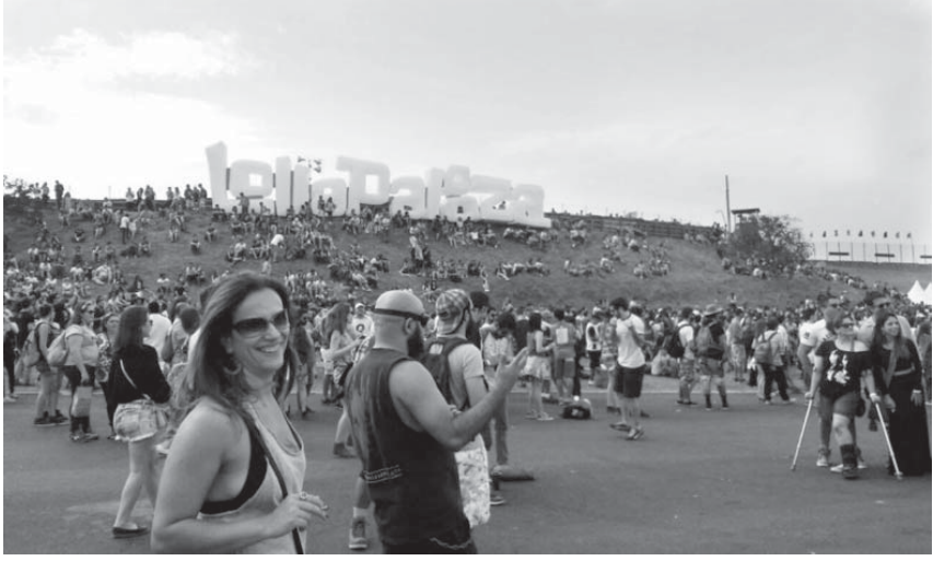
ロラパルーザの風景

12、13日に聖市南部のインテラゴス・サーキットで行われた、恒例のロック・フェスティバル「ロラパルーザ・ブラジル」は2日で16万人を集める盛況だったにも関わらず、国民の話題を掴みこみ続けた。