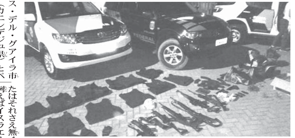
今年2月5日に聖州サンセバスチャン市で警察が押収した武器類

に輸入すると同時に大量の火器等々を密輸出入する「蝶番国」だと断じている。 なお、サンパウロ市とリオ市に夫々本拠を置く「PCC」及び「CV」各暴力団はパラグアイのブラジルとの国境に接するアマンバジュ、カニンデジュ、アルトパラナ県に各支部を戦略的に設置している。 伯国連邦警察は最近2年間にエステ市の2万丁に及ぶ密輸の小火器、銃器を押収しており、アリアスの「平和財団」の推計では全体で毎年3万丁の各種火器がパラグアイ各地の要衝経由ブラジルに不法導入されていると見ている。 内務省の人権局によれば、パラグアイ全国で正式に登録されていない銃器は70万丁に及び、一方国防省のDIMAB E.L.軍用資材管理局では国境地帯に於ける民間所持の火器取締を徹底する能力に欠けると云う。 ちなみに、同報告書によればパラグアイで正規に登録されている民間警備会社は210社存在し、その雇用ガードマンは2万4千人に達し、実働警官1万人の倍以上の要員数である。