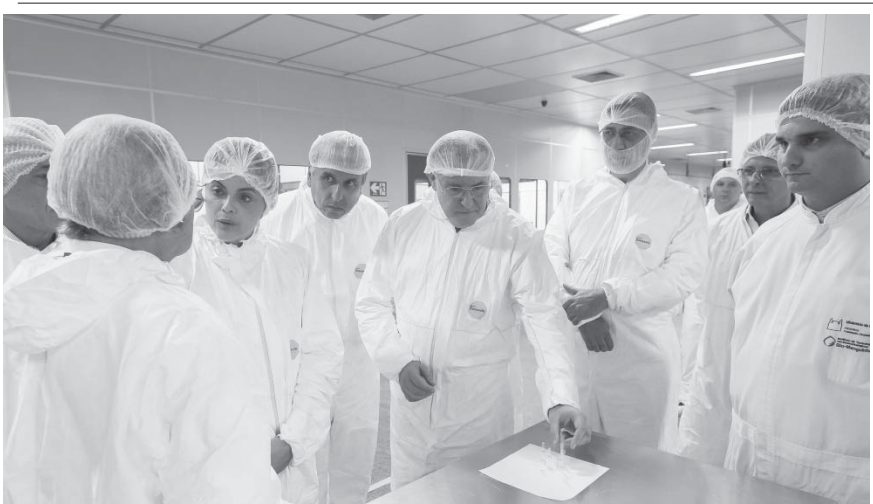
白衣姿でオズワルド・クルス研究院職員の説明に耳を傾けるジウマ大統領 (左から3番目)

ジウマ大統領は10日午後、リオ市北部のオズワルド・クルス研究院 (Fiocruz) 内に