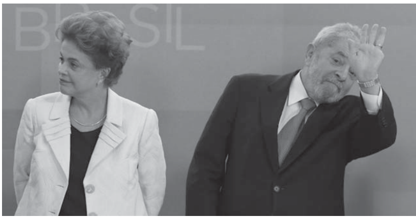
17日の就任式でのルラ氏とジウマ氏