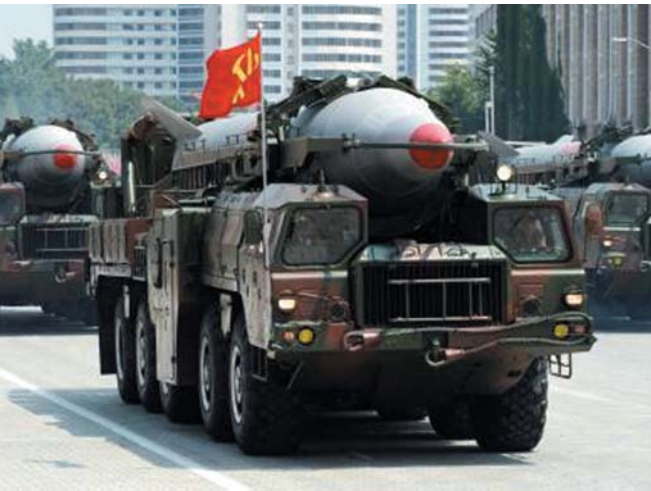
2013年7月、軍事パレードに登場した中距離弾道ミサイル「ノドン」=平壤の金日成広場

【ソウル共同】韓国軍によると、北朝鮮は18日午前、西部の平安南道甯川府近郊からミサイル2発を発射した。1発は日本時間午前5時55分ごろ発射され、約800キロ飛行で東方の日本海に落ちたもよう。日本のほぼ全域を射程に収める中距離弾道ミサイル「ノドン」と推定される。日本は北朝鮮に厳重抗議した。日米韓3カ国は米ワシントンで3月31日から2日間の日程で開かれる核安全保障サミットに合わせ、日米韓首脳会談を開く方向で最終調整に入った。