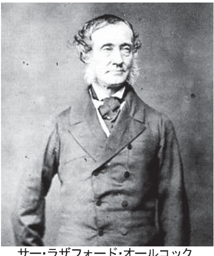
サー・ラザフォード・オールコック (1809年—1897年)

物価とみに騰貴し、一定の俸禄に衣食する土人(武士階級)は最も困難を蒙り、此処において外夷(外国の野蠻人)は無用の奢侈品(ぜいたく品)を移入して、我が日常生活の必需品を奪い、我を疲弊せしめて、遂に呑噬(侵略)の志を逞しくするものなり、此の禍源を開けるは幕府なりと、天下