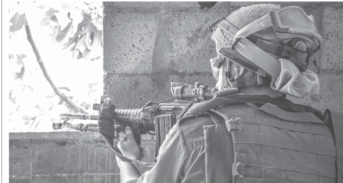
ガザ地区のイスラエル軍兵士(1 de agosto de 2014. Foto: Israel Defense Forces)

「ウソをつくこと」は、情報戦の一部なので、慰安婦問題などで日本が抱えているフラストレーション(欲求不満)は、「完全な証拠を提示しても、日本側の主張をほとんどきいてもらえないこと」です。