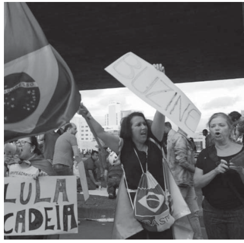
16日に起きたサンパウロのパウリスタ大通りでのデモ

リオ五輪の政治危機を背景に、スポンサーが本社説明に忙殺している。スポンサーは、リオ五輪の政治危機を背景に、本社説明に忙殺している。