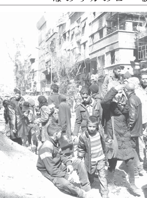
破壊されたシリアの町並みと難民たち(Damascus- Siria, 27/02/2014. Foto: UNRWA)