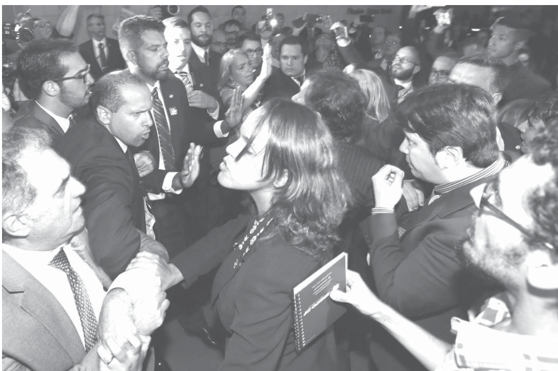
28日、ブラジル弁護士協会による新しい大統領罷免請求に対し、親PT派と一触即発の緊迫状況に

この罷免案は、下院の全員出席の議会で討議され、採決の投票に掛けられることになっています。下院議員(定数513人の3分の2が罷免案に賛成すれば、その後ジウマ)。