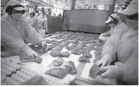
チリのサーモン工場の様子