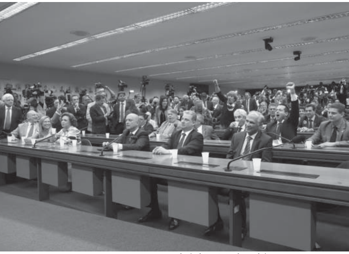
29日、PMD Bの連立離脱発表の様子