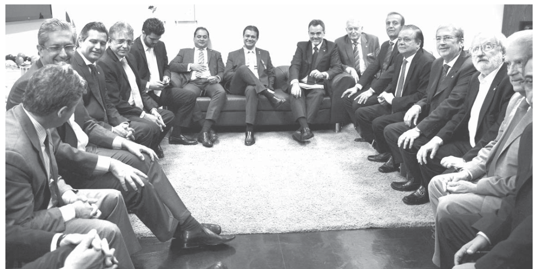
29日、インピーチメント推進派の「陣中」の様子

この罷免案は、下院の全員出席の議会で討議され、採決の投票に掛けられることになっています。下院議員(定数513人の3分の2が罷免案に賛成すれば、その後ジウマ)。