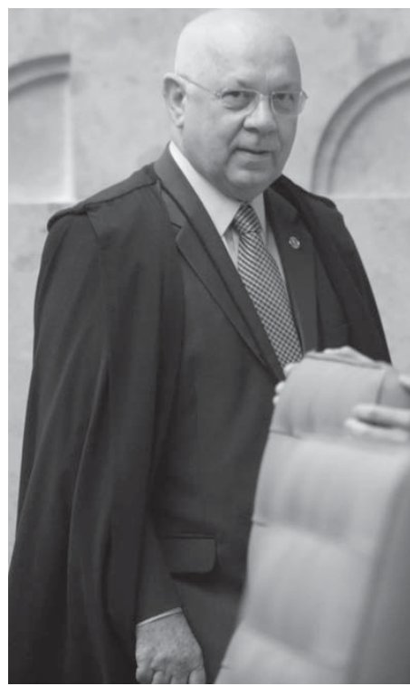
連邦最高裁のテオリ判事

テオリ判事は最高裁でのLJ審理の報告官で、31日の審理では「行き過ぎた行為は捜査全体を無効にする危険がある」として、モロ判事が3月16日に録音されたルーラ氏とジウマ大統領の通話記録を公開したことを間接的に批判した。