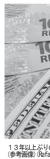
13年以上ぶりの月間上昇を記録した伯国株式 (参考画像)

企業だ。ブラジル銀行は3月で46.72%の上昇を記録。石油公社のペトロラス(PB)は一般株で44.22%、優先株で61.87%の上昇を記録した。PBC社の株値上昇には、国際的な原油価格の上昇も影響している。コロンボ氏は、実体経済の回復はまだ先と前置きしつつ、今後数カ月で大統領罷免が起きれば