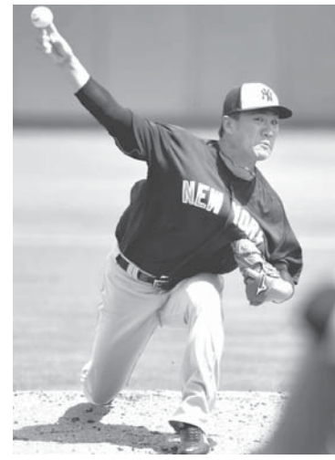
打者に投球するヤンキース・田中