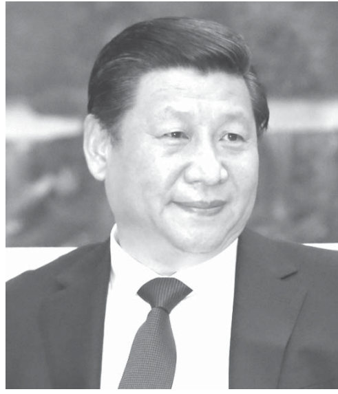
2013年、ブラジル訪問時の習近平第7代国家主席

世界3大戦略家のルトワックさんが「習近平はゴルバチョフ」と語っておられます。なぜ? 習近平は、ソ連を崩壊させた男ゴルバチョフと同じだ、というので