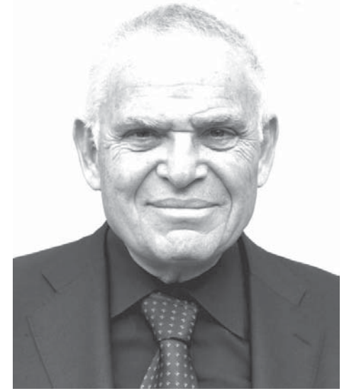
エドワード・ルトワック (Edward Nicolae Luttwak, 1942年11月4日-) は、アメリカ合衆国の歴史学者

世界3大戦略家のルトワックさんが「習近平はゴルバチョフ」と語っておられます。なぜ? 習近平は、ソ連を崩壊させた男ゴルバチョフと同じだ、というので