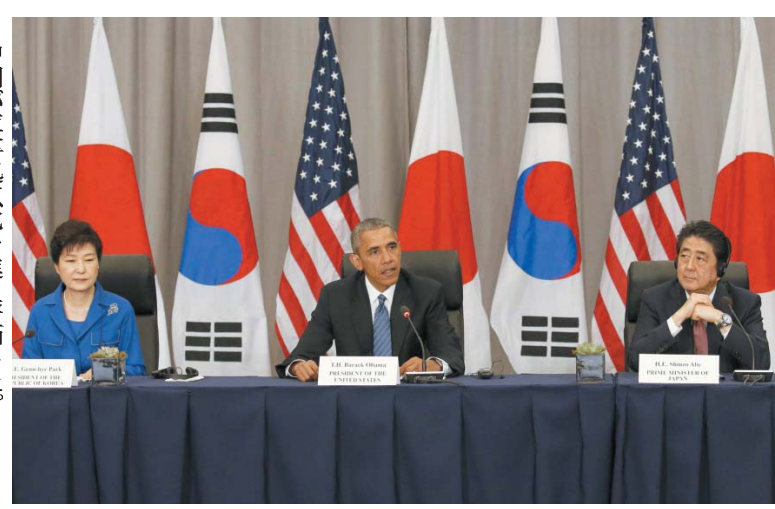
会談する(右から)安倍首相、オバマ米大統領、朴槿恵韓国大統領 =3月31日、ワシントン

【ワシントン共同】安倍晋三首相は3月31日午前（日本時間同日深夜）、オバマ米大統領、朴槿恵韓国大統領とワシントンで会談し、北朝鮮による核や弾道ミサイル開発を阻止するため、3カ国の安全保障分野での協力強化で一致した。国連安全保障理事会の北朝鮮制裁決議や各国の独自制裁履行を徹底し、圧力を強める方針も確認した。3カ国首脳会談は2014年3月以来、2年ぶり。