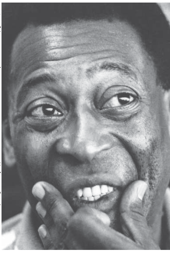
ペレ(75歳)を迎えた。昨年10月に75歳を迎えたペレ

サッカーの王様ペレ(75)が6日、サンパウロの有力紙「フォーリヤ・デ・サンパウロ」(F)本社を訪問し、独占インタビューに応じた。ペレは2012年にサンパウロとニューヨークで受けた人工股関節埋込み手術で医療ミスがあり、そのせいで昨年12月に手術する必要があったと語った。昨年末の手術以来4カ月が過ぎ、今は痛みもなく、リオ五輪に出場する準備はできていると冗談を言うほどだった。しかし歩行には若干のきこちなさが見られ、左手には杖が握られていた。