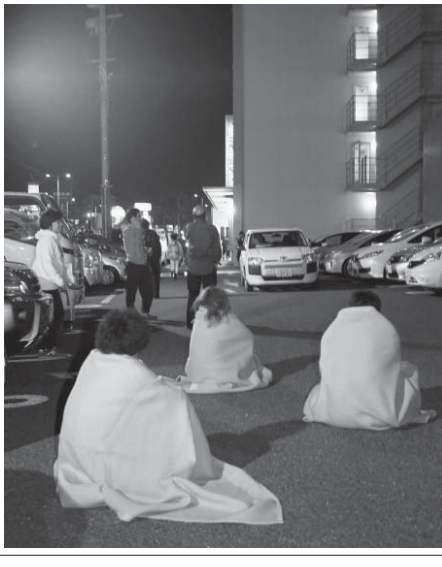
警察や消防によると、益城町では家屋が10戸以上倒壊して多くの住民が下敷きになった...