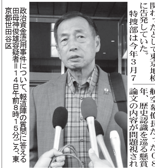
政治資金流用事件について報道陣の質問に答える田母神元空幕僚長